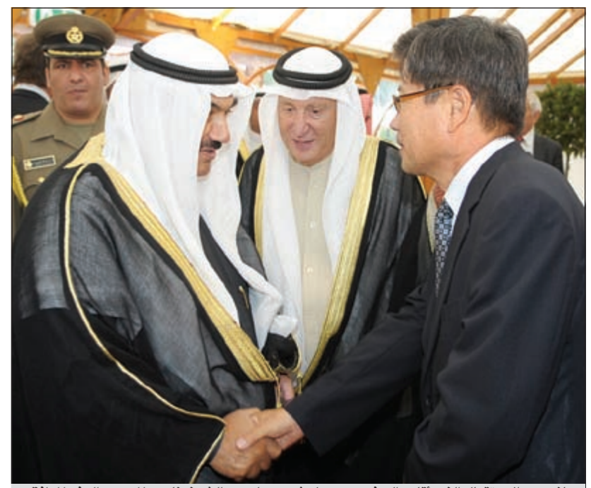
جانب من الاستقبال الذي أقامه السفير د.سهيل شحيبير لسمو الشيخ ناصر المحمد والوفد المرافق