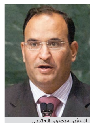
السفير منصور العتيبي

العتيبي: لقاءات ثنائية سيجريها رئيس الوزراء على هامش الاجتماعات مع قادة رؤساء الدول لتنسيق القضايا المشتركة المحمد سيستعرض موقف الكويت من المستجدات الإقليمية والدولية أمام الأمم المتحدة