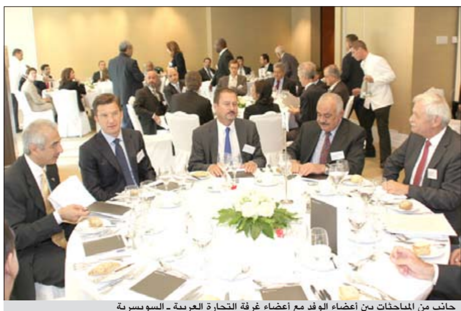
جانب من المباحثات بين أعضاء الوفد مع أعضاء غرفة التجارة العربية - السويسرية

أفريقيا والمتعلق بالعنصرية ومكافحة التطرف والكرهية والمزمع عقده في 22 سبتمبر الجاري. كما ستختلل المناقشة العامة التي سيحضرها عدد كبير من رؤساء الدول والحكومات اجتماعات أخرى رفيعة المستوى دعا إليها السكرتير العام للمنظمة الدولية بان كي مون ومنها الاجتماع حول السلامة والأمن النووي الذي سيعقد أيضا في 22 سبتمبر الجاري. وقال السفير العتيبي انه من المنتظر أن يلقي سمو رئيس مجلس الوزراء كلمة الكويت أمام الجمعية العامة يوم الخميس المقبل. وأضاف انه سيستعرض فيها موقف الكويت من المستجدات على الساحة الإقليمية والدولية وسيطرق لدور الأمم المتحدة في مواجهة التحديات والمخاطر العالمية وأهمية الدور الحيوي الذي تقوم به الأمم المتحدة خصوصا أن هناك قضايا دولية مهمة جدا يتطلب تعاملا وتراجها تنسيقا وتعاوناً دوليين بين الدول الأعضاء. وأوضح ان من أهم هذه القضايا تغير المناخ وتحقيق السلم والأمن الدوليين في مناطق مختلفة من العالم وقضايا نزع السلاح والأمن الغذائي وارتفاع أسعار المواد الأساسية وتذبذب أسعار الطاقة وتحقيق الأهداف الإنمائية للألفية. وأضاف السفير العتيبي ان «كل هذه القضايا الدولية