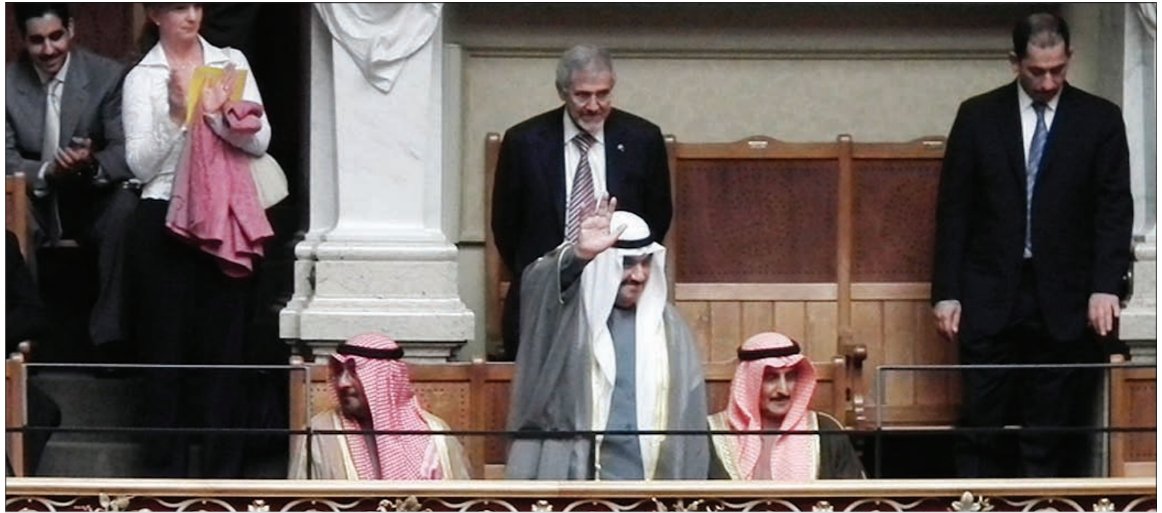
سمو الشيخ ناصر المحمد محبياً أعضاء البرلمان السويسري خلال زيارته له