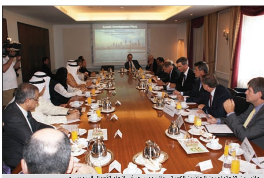
جانب من الاجتماع بين الجانبين الكويتي والسويسري في اتحاد الأعمال السويسري

الأمم المتحدة - كونا: قال مندوبنا الدائم لدى الأمم المتحدة السفير منصور العتيبي ان سمو رئيس مجلس الوزراء الشيخ ناصر المحمد سيرأس وفد الكويت رفيع المستوى الذي سيشارك بداية من الأسبوع المقبل في الدورة الـ 66 للجمعية العامة للأمم المتحدة التي تعقد هذا العام في ظل «تغيرات غير مسبوقة» في المنطقة. وقال السفير العتيبي في تصريح لـ «كونا» الليلة قبل الماضية «أهمية هذه الدورة مقارنة بالدورات السابقة تكمن في كونها تعقد في ظل تطورات وتغيرات غير مسبوقة في المنطقة وكذلك في ظل التحرك العربي لدعم المساعي الفلسطينية للحصول على العضوية الكاملة في الأمم المتحدة». وأضاف ان المناقشة العامة للجمعية العامة التي ستدور من 21 إلى 27 من الشهر الجاري ستختلها عدد من الاجتماعات رفيعة المستوى التي ستعقد في مقر الأمم المتحدة. وأوضح ان من أهمها الاجتماع المتعلق بالأمراض غير المعدية وتأثيراتها على صحة الإنسان والاجتماع المعني بالتصحر وانعكاساته على التنمية المستدامة الذي سيمهد مؤتمر القمة الذي سيعقد في ريو بالبرازيل في يونيو المقبل. أضافة إلى الاجتماع المعني بإحياء الذكرى العاشرة لإعلان برنامج عمل دربن بجنوب