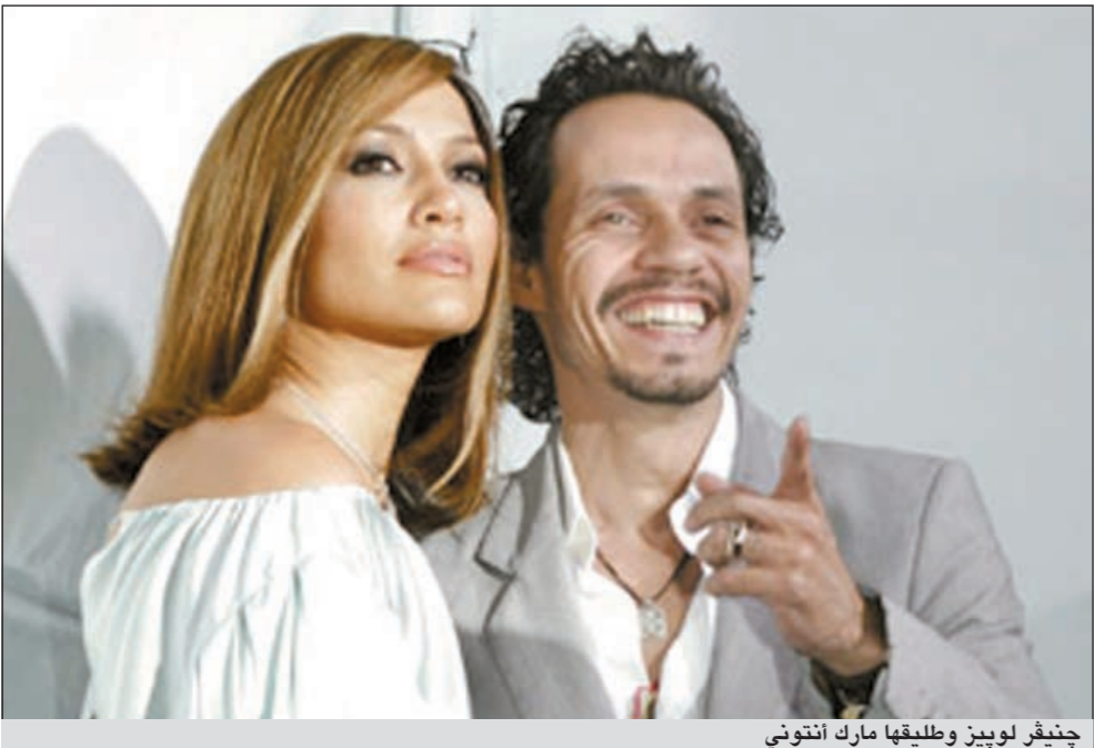
چنيفر لوبيز وطليقها مارك أنتوني

باريس - أ.ش. كشف مجلة «كلوزير» الفرنسية أن الممثلة والمغنية الأميركية چنيفر لوبيز لاتزال متائرة بطلاقها من الممثل مارك أنتوني والد طفلها التوأم في الوقت الذي يبدو فيه أنتوني في منتهى السعادة بتعدد علاقاته الغرامية. واستشهدت المجلة في ذلك بالحرز الذي يرسم