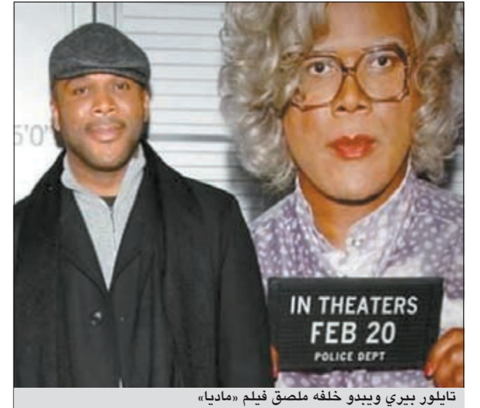
تايلور بيرري وبيجو خلفه ملصق فيلم «ماديا»

لوس انجليس - د.ب.أ: قد لا يكون الممثل والمنتج والمخرج الأميركي ذو الأصول الأفريقية تايلور بيرري مشهوراً على المستوى العالمي مثل المخرج ستيفن سبيلبرج أو ليوناردو دي كابريريو أو جوني ديب ولكن هذا لم يمنعه من الحصول على لقب الأعلى أجراً في القائمة السنوية لمجلة فوربس. وجاء في القائمة التي نشرت الثلاثاء إن بيرري الذي يكتب ويخرج ويمثل برنديا زي امرأة في سلسلة أفلام كوميدية حول زعيمة السود ماديا حصل على 130 مليون دولار في الفترة من مايو 2010 ومايو 2011 ليحتل بذلك لقب الأعلى أجراً خلال تلك الفترة.