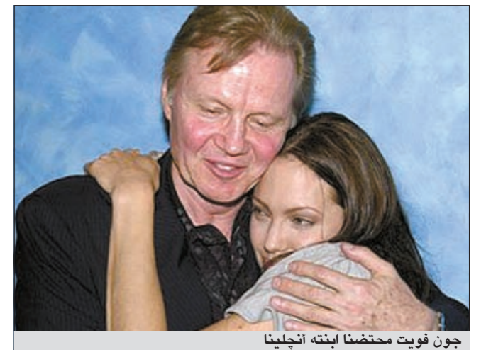
جون فويت محظناً ابنته أنجلينا

لوس انجليس - يو.بي.أي: أعرب الممثل الأميركي جون فويت عن فخره الكبير بابنته النجمة الهوليوودية أنجلينا چولي مؤكداً أن رؤيتها مع الأولاد تؤثر فيه كثيراً. وقال فويت (72 سنة) في مقابلة مع مجلة «يو إس ويكلي» الأميركية «لا يمكن أن أكون أكثر فخراً مما أنا عليه بابنتي ليس لأنها أم رائعة وحسب بل بسبب كل الخير الذي تقوم به في العالم».