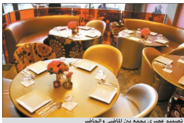
تصميم عصري يجمع بين الماضي والحاضر

افتتحت مجموعة كوت الغذائية الفرع الثاني لمطعم «أيامي» الشهير بالماكولات الشرق أوسطية في «الفيلاج» في أبوالحصانية بعد أكثر من 3 سنوات من النجاح المتواصل الذي حصده فرعه الأول في المارينا كرسنت.