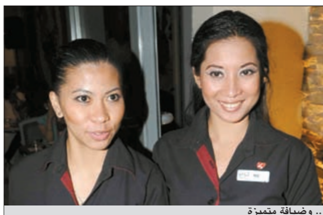
.. وضيافة متميزة