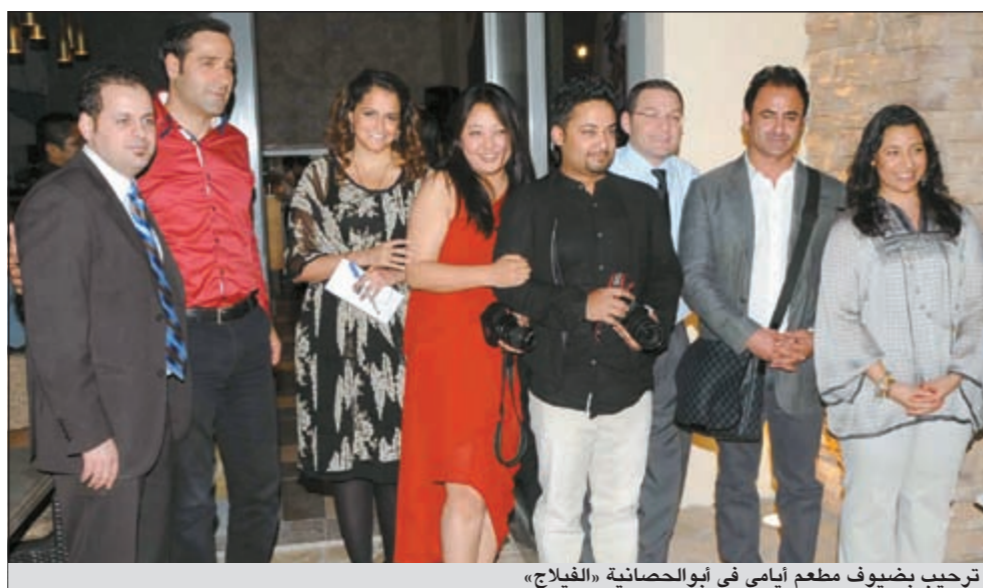
ترحيب بضيوف مطعم أيامي في أبوالحصانية «الفيلاج»