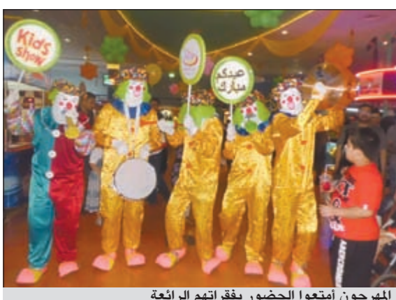
المهرجون امتعوا الحضور بقرائهم الرائعة