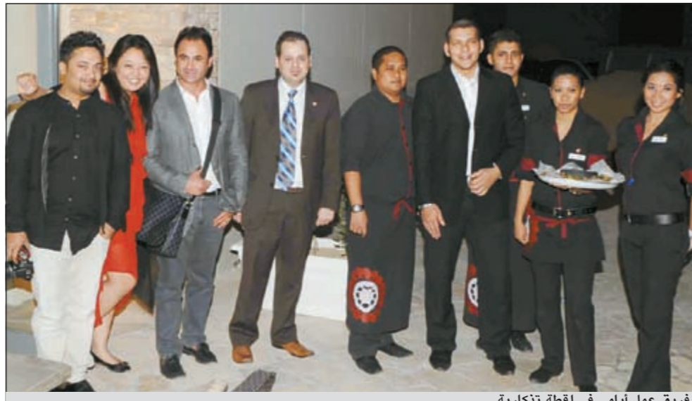
فريق عمل أيامي في لحظة تذكارية