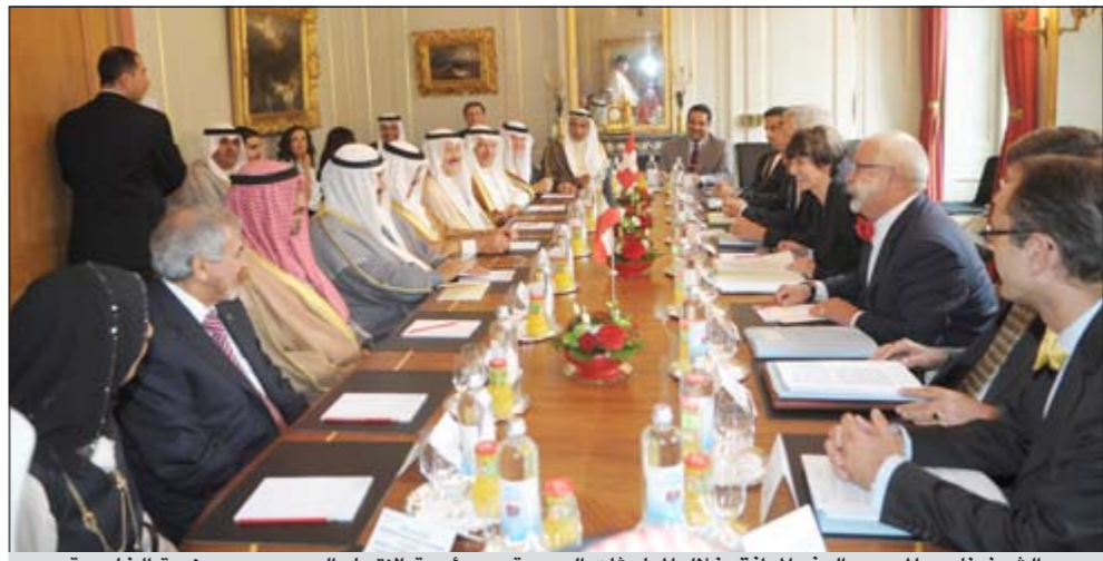
سمو الشيخ ناصر المحمد والوفد المرافق خلال المباحثات الرسمية مع رئيسة الاتحاد السويسري ووزيرة الخارجية