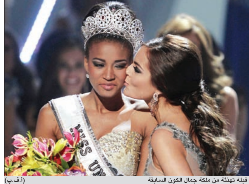
قبله تهنئة من ملكة جمال الكون السابقة

واحتفلت مسابقة ملكة جمال الكون للعام 2011 بمرور سنتين عاماً على انشائها، وقد توجت المكسيكية خيمينا نافاريتي ملكة جمال الكون 2010، خليفتها على عرش الجمال. وعلى جري العادة مرت المشاركات بلباس السباحة اوو ومن ثم في فستان السهرة قبل ان يخضعن لاسئلة اعضاء لجنة الحكم، ومن بين اعضاء لجنة الحكم السبعة هذه السنة في ساو باولو