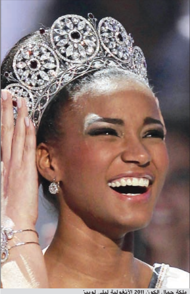
ملكة جمال الكون 2011 الأنغولية ليلي لوبيز