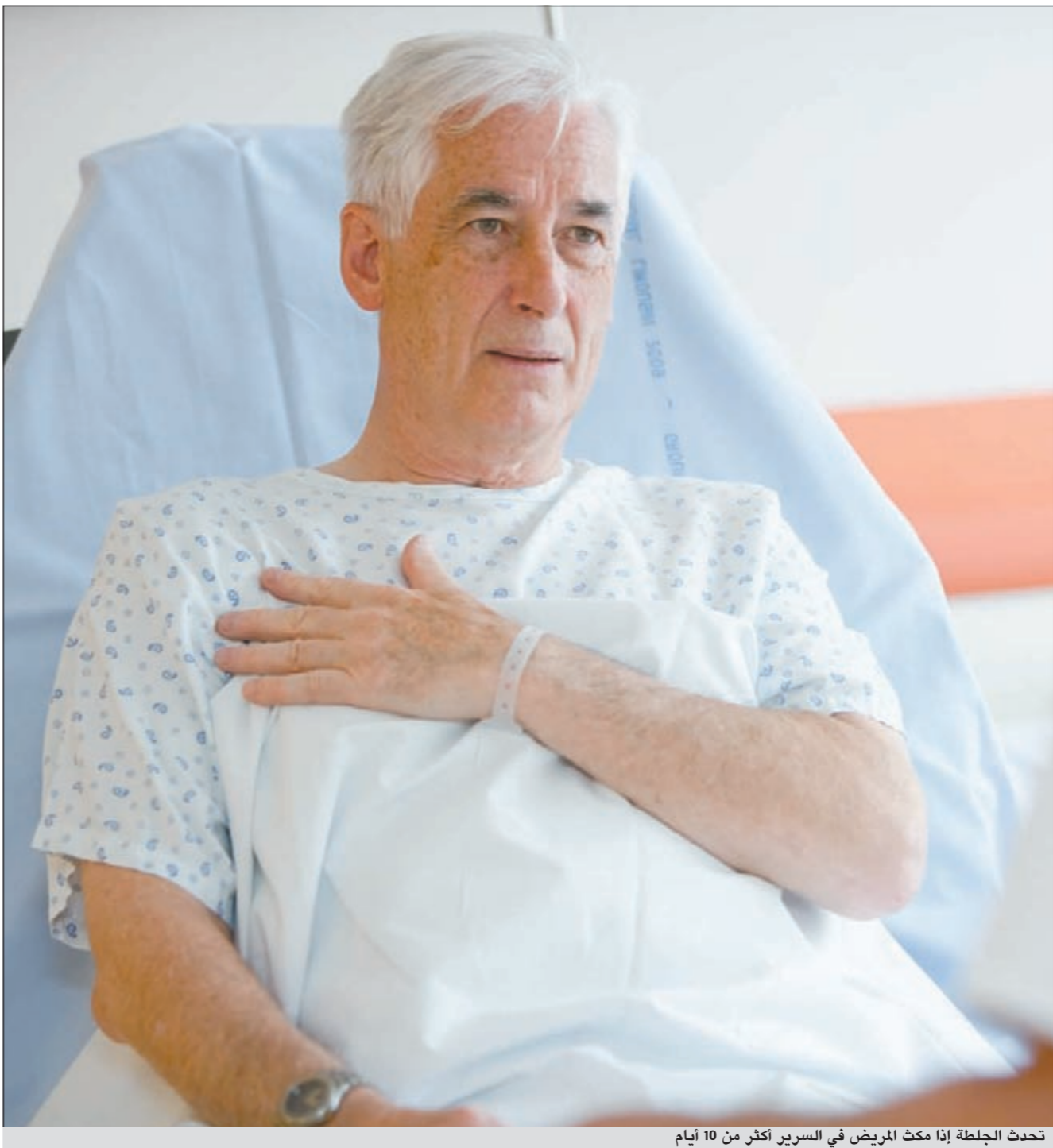
تحدث الجلطة إذا مكث المريض في السرير أكثر من 10 أيام

للطعام الصحي تأثير يمنع الإصابة بأمراض القلب وضغط الدم وأفضل خيارات الأطعمة التي تؤدي إلى تجنب الإصابة بأمراض القلب، هي: الخضراوات والفواكه، الدهون احادية عدم التشبع او عديدة عدم التشبع مثل زيت الزيتون وزيت الصويا، والبذور والمكسرات التي تحتوي على نفس أنواع الدهون، وكذلك الأسماك والحبوب الكاملة.