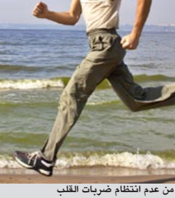
عدم الجري لمن يعاني من عدم انتظام ضربات القلب

بل تحصلت، والتصقت بالأعاء، فكيف لها أن تزول ويزول التحوصل؟ ● السبب الأساسي هو تكرار الطعام نفسه، فعلى إبتك أن يتعد عن الوجبات السريعة إذا كان يتناولها ويتناول غذاء صحياً مطهياً في المنزل مع تناول حبوب اسمها «ميفازول»، فمئة شراب