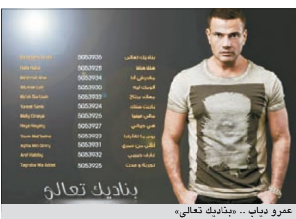
عمرو دياب .. «بناديك تعالي»

ومن المقرر طرح ألبوم «بناديك تعالي» 27 الجاري، ويحمل 12 أغنية، قام «دياب» بتلحين 8 منها، بالإضافة إلى اشتراكه في تلحين 3 أغنيات أخرى.