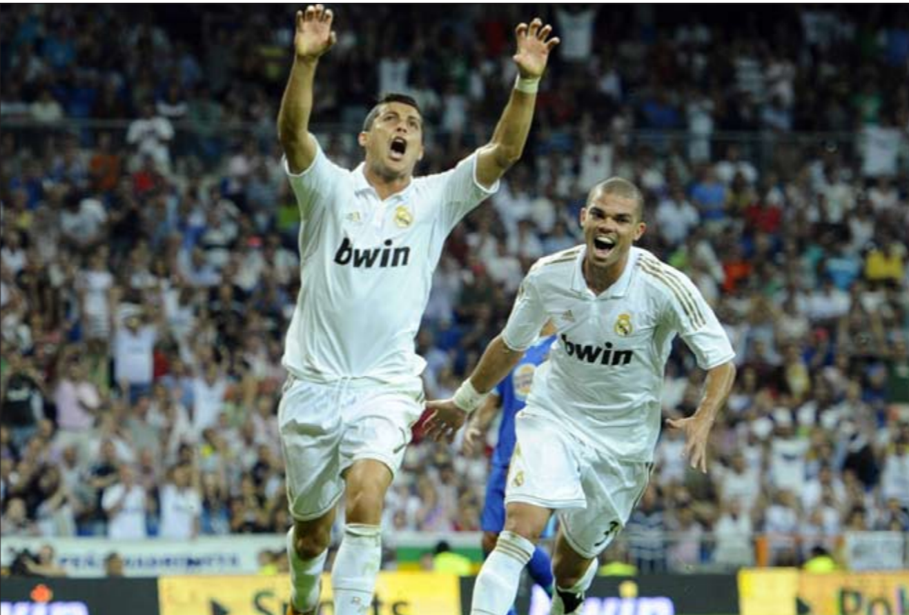
نجم ريال مدريد رونالدو تالق أمام خيتافي وسجل هدفا وهما يحتفل مع بيبي

ميكرا واستهل مسيرته في الدوري الإيطالي لكرة القدم هذا الموسم بفوز ساحق 4 - 1 على ضيفه بارما امس على ملعبه