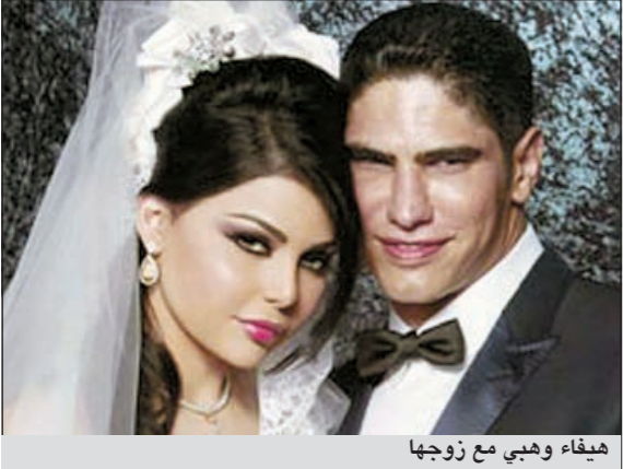
هيفاء وهبي مع زوجها

نفت الفنانة هيفاء وهبي ما تردد أخيرا عن ظهور زوجها معها في كليتها الجديد «يهرب من عينيك» الذي تنوي تصويره في الفترة المقبلة. وقالت النجمة اللبنانية في تصريح لموقع «أنا زهرة»: «زوجي ليس موديل حتى يظهر معي في الكليبات. هو رجل أعمال، لكل منا عمله، ولا أعرف من يقف وراء ترويج هذه الأقاويل». وأضافت: «فوجئت بانتشار تلك الأقاويل التي لا أعلم مصدرها، كما فوجئت باخبار تزعم أنني قررت إعادة فتح الألبوم لتسجيل أغنية لأجل زوجي وهذا غير صحيح، فقد انتهت من تسجيل الألبوم منذ فترة».