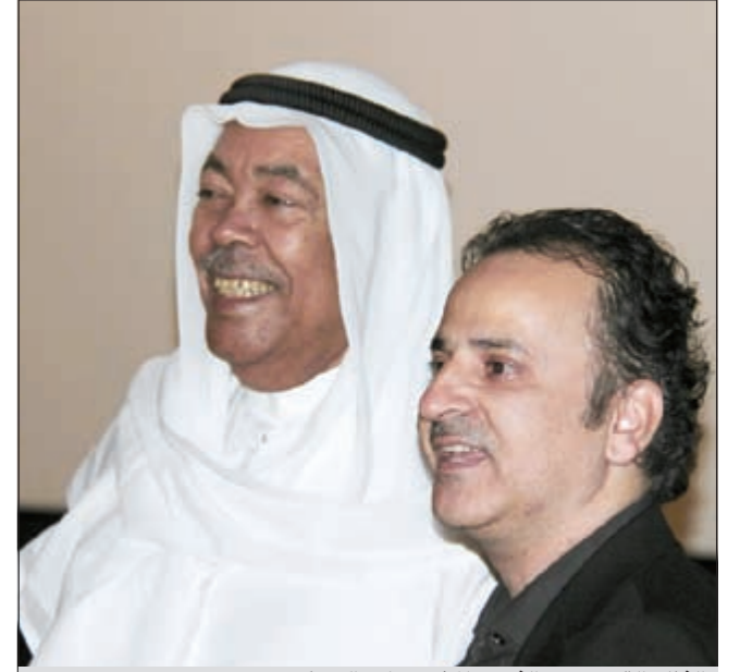
الفنان القدير سعد الفرج والمخرج وليد العوضي

المغامرة، إلى جانب ما خلقته في نفسه من رغبة عارمة في إنجاز هذا العمل السينمائي الأضخم، في العالم العربي، على الصعيد الإنساني والسياسي والاجتماعي، رغم علمه بلامستته بعض الجوانب الدينية التي يتجنبها المخرجون في أيامنا هذه. ويحكى الفيلم قصة رحلة أب وأم كويتيين في أفغانستان بحثا عن ابنتهما الذي ضل الهدى وغرر به فالتحق بخليعة إرهابية، هناك، وتودر الأحداث في مخيم «تورا بورا» للاجئين، عارضا المخاطر التي تعرض إليها الأب والأم وكذلك للابعد السياسية