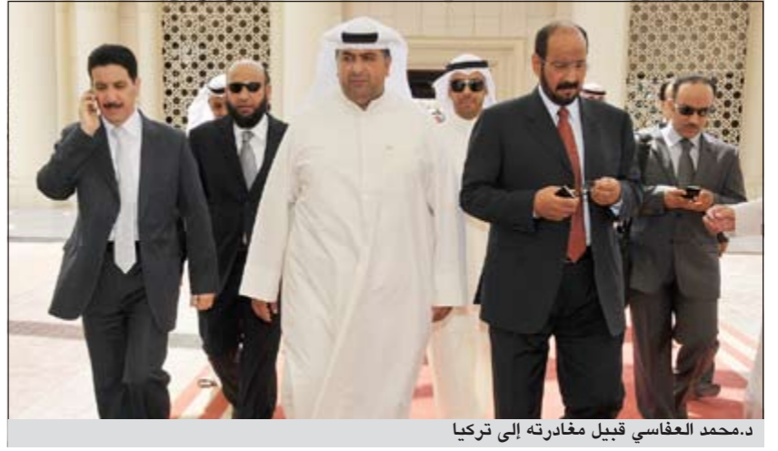
د.محمد العفاسي قبيل مغادرته إلى تركيا

كشف نائب رئيس مجلس الوزراء وزير العدل ووزير الشؤون د.محمد العفاسي أنه بعد إغلاق استخراج تصاريح العمل، «ما عدا العقود المستفاد منها المتعلقة بالتنمية والمشاريع الكبرى»، وجدنا أن من دخلوا بقبول مؤقتة وجولت إلى إقامة عمل أكثر من 15 ألف وافد، «وكأنك يا أبو زيد ما غزيت».