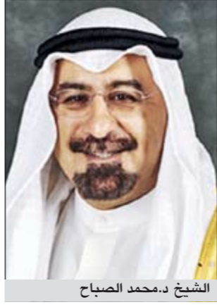
الشيخ د.محمد الصباح

يتوجه نائب رئيس مجلس الوزراء ووزير الخارجية الشيخ د.محمد الصباح اليوم إلى جدة للمشاركة في الدورة الـ 120 لوزراء خارجية مجلس التعاون لدول الخليج العربية.