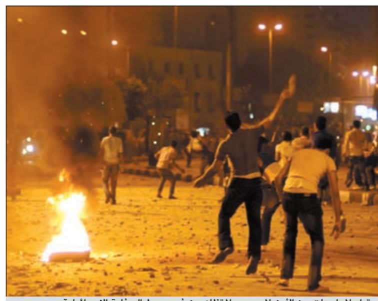
احتدام المواجهات بين الأمن المصري والمظاهرات في محيط السفارة الإسرائيلية

علمت «الأنباء» أن مجلس الوزراء اعتمد ترقية العمداء: فيصل الصولة وعبدالله السلاحي وخميس الفرخان إلى رتبة لواء، كما اعتمد أيضاً ترقية ضباط الجيش من الدرجة 16 وعددهم 155 ضابطاً من رتبة مقدم إلى عقيد والدرجة 21 وعددهم 160 ضابطاً من رتبة رائد إلى رتبة مقدم، وقالت مصادر عسكرية مطلعة لـ «الأنباء» أنه سيتم إحالة كشوف الترقيات إلى صاحب السمو الأمير القائد الأعلى للقوات المسلحة تمهيداً لصدور مرسوم أميري بهذه الترقيات. من جهة أخرى، كشف مصدر عسكري مطلع في وزارة الدفاع أن سبب عدم اعتماد ترقية الدرجة 27 وعددهم 140 من رتبة نقيب يرجع إلى تدقيق الكشوفات من جديد من قبل رئاسة الأركان والتدقيق مجدداً على ملفاتهم وشهاداتهم الثانوية، وتوقع المصدر أن يتم رفع كشوفات ترقيتهم إلى النائب الأول لرئيس مجلس الوزراء ووزير الدفاع الشيخ جابر المبارك خلال الأيام القليلة المقبلة لاعتمادها، مشيراً إلى أن الدرجة تضم عدداً من الضباط من أصحاب الشهادات العليا (أطباء ومهندسين وحقوقيين) وترقيتهم كانت من المقترح أن تتم في العام 2009.