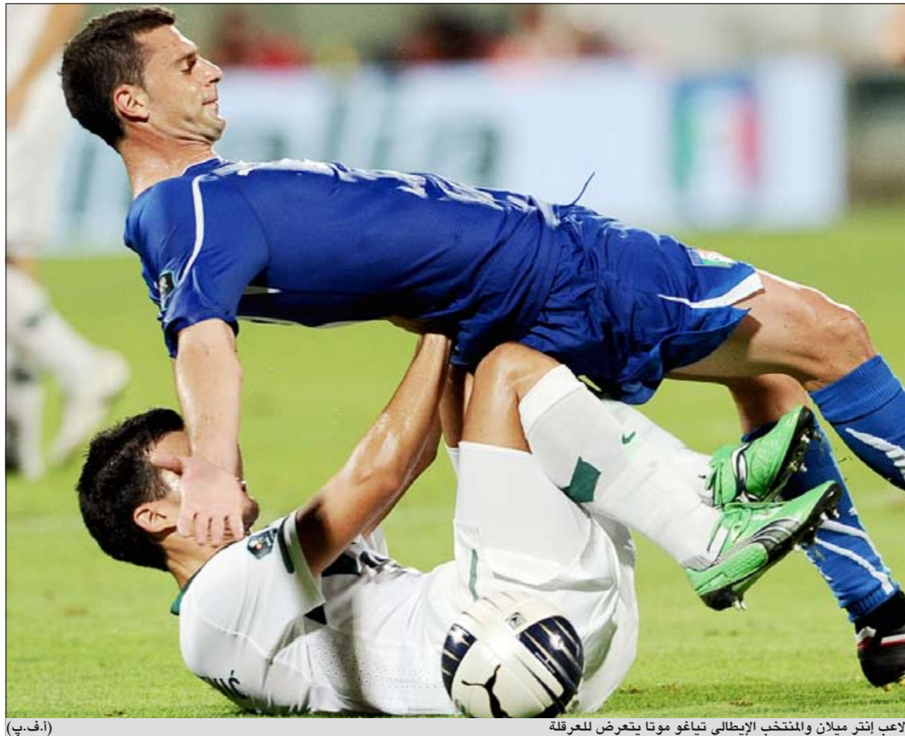
لاعب إنتر ميلان والمنتخب الإيطالي تياغو موتا يتعرض للتعرق

الملاعب. من جهته، بنوي قائد انتر ميلان الإيطالي المدافع المخضرم الأرجنتيني خافيير زانيتي تحطيم الرقم القياسي لتمثيل بطل أوروبا 2010. ويملك المدافع الدولي السابق جوزيبي برغومي الرقم القياسي في حمل اللوان انتر، إذ خاض 768 مباراة تحت الوانه، أكثر بخمس مباريات من زانيتي. وقال زانيتي (38 عاما) لصحيفة «لا غازيتا ديلو سبور» الإيطالية «يتوقف