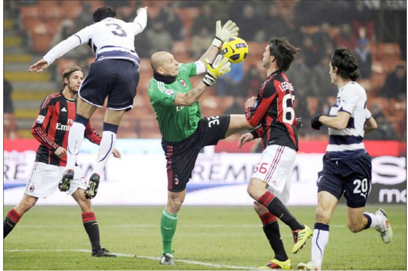
مواجهة مثيرة في انطلاق المرحلة الثانية للدوري الإيطالي بين البطل ميلان ولاتسيو