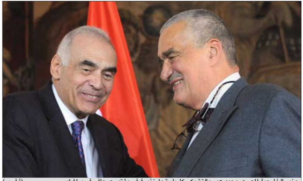
وزير الخارجية المصري محمد عمر والتشيكى كاريل شوارزنبيرغ في مؤتمر صحفي في براغ أمس (أ.ف.ب)

القاهرة - وكالات: في نقطة تحول في محاكمة الرئيس المصري السابق حسني مبارك، فجر الشاهد الثامن مفاجأة من العيار الثقيل امس عندما اتهم وزير الداخلية الأسبق حبيب العادلي ومساعديه بالمسؤولية عن قتل المتظاهرين. من جانبه، وصف المستشار أحمد رفعت، القاضي الذي ينظر محاكمة مبارك - شهادة الشاهد الثامن، المقدم عصام حسني، بـ «الاستثنائية»، وقال: إنه سمع ما أدلى به في شهادته، لكنه لم يشاهد ما حدث. وكان عصام حسني، المقدم بالإدارة العامة لشؤون المجندين بالأمن المركزي والشاهد الثامن في قضية مبارك، في قضية قتل النوار أمام محكمة جنايات القاهرة أمس، قد أكد وجود سلاح آلي في منطقة وسط القاهرة يوم 28 يناير.