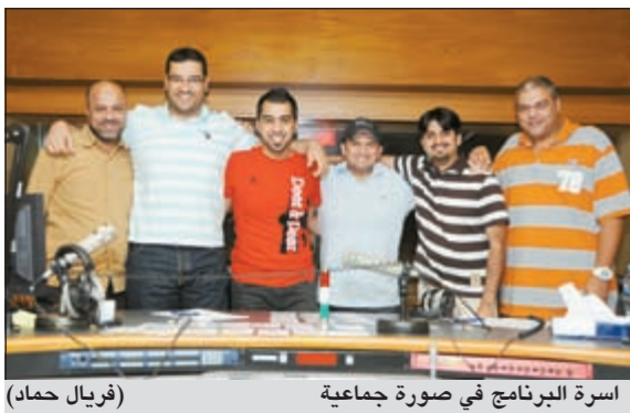
أسرة البرنامج في صورة جماعية