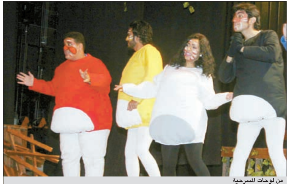
من لوحات المسرحية