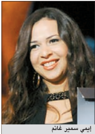
إيمي سمير غانم

القاهرة - أ.ش.أ: تستأنف الفنانة إيمي سمير غانم تصوير فيلم «مؤنث سالم» غدا السبت وتعود أحداث الفيلم في إطار من الكوميدي والتشويق.