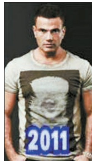
عمرو دياب وتامر حسني.. نفس البوستر!

إحدى شركات المحمول بطرحها للجمهور برقم متخصر. ومن المقرر ان يتم طرح الألبوم في 28 سبتمبر الجاري تحت رعاية شركة «روتانا» المنتجة والموزعة للألبوم. وعلى الجانب الآخر، استقبل موقع الـ «فيسبوك» خلال الساعات الأخيرة عددا كبيرا من الصفحات الالكترونية التي تحمل اسم الألبوم، كما انتشرت صور الألبوم الجديد ما عدا البوستر الذي سيتم طرحه خلال الأيام القادمة. أكد عدد كبير من محبي عمرو أنهم سيبدأون خلال الأسبوعين المقبلين حملة لشراء الألبوم بالطرق الشرعية وعدم تحميله من الانترنت، وستبدأ الحملة