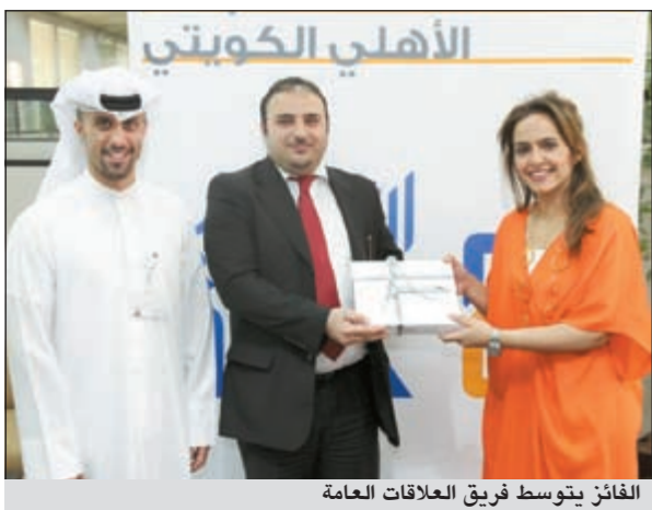
الفائز بتوسط فريق العلاقات العامة

دائماً لتنظيم مثل هذه المسابقات طوال العام لموظفيه والتي يتم خلالها تعزيز روح التواصل وتنمية العلاقات الاجتماعية بينهم.