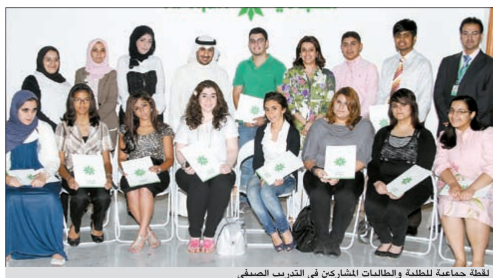
لقطة جماعية للطلبة والطالبات المشاركين في التدريب الصيفي

أعلن البنك التجاري الكويتي عن اختتام فعاليات برنامج التدريب الصيفي لآبناء وأقارب الموظفين وكذلك عملاء حساب الشباب لدى التجاري @Tijari والموجه للطلبة والطالبات الذين تتراوح أعمارهم بين 16 و22 سنة والذي انطلق في 26 يونيو الماضي واستمر حتى أغسطس الماضي. وقد هدف البرنامج إلى إتاحة فرص التدريب للطلبة واكتسابهم الخبرات والمعلومات الأولية حول طبيعة العمل في القطاع المصرفي والتعامل مع العملاء وشغل أوقات فراغهم في مجالات مفيدة. وفي هذا السياق، قالت