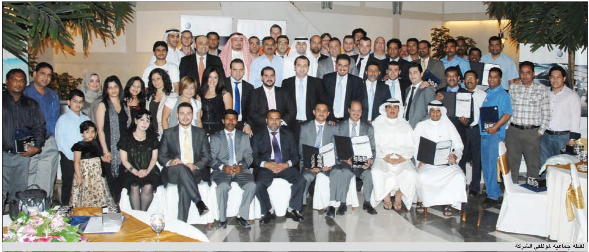
لقطة جماعية لموظفي الشركة

وأشارت إلى أنها حريصة على أن تعيد الروح الإنسانية إلى مجال الأعمال التجارية في سالنها، وذلك من خلال خلق أجواء مفعمة بالمودة والترابط داخل نسج المجتمع. وشددت على أن «زين» ستظل تبذل قصارى جهدها لخلق تأثير إيجابي على المجتمع، معتمدة في ذلك على روح المسؤولية الاجتماعية التي تصاحب حركتها في جميع النشاطات التجارية.