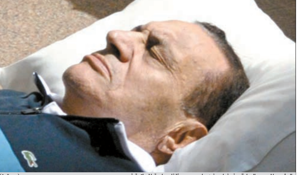
الرئيس المصري السابق مغمضا عينيه على سيره أثناء جلسة المحاكمة أمس

القاهرة- وكالات: قررت محكمة جناتيات القاهرة التي تحاكم الرئيس المصري السابق محمد حسني مبارك استدعاء رئيس المجلس الأعلى للقوات المسلحة المصرية المشير محمد حسين طنطاوي، والمسك بالسلطة حاليا، ورئيس الأركان سامي عنان والرئيس السابق لجهان المخابرات اللواء عمر سليمان ووزير الداخلية الحالي منصور العيسوي، ووزير الداخلية السابق محمود وجدي، للشهادة الأسبوع المقبل في جلسات سرية. وقال رئيس المحكمة القاضي