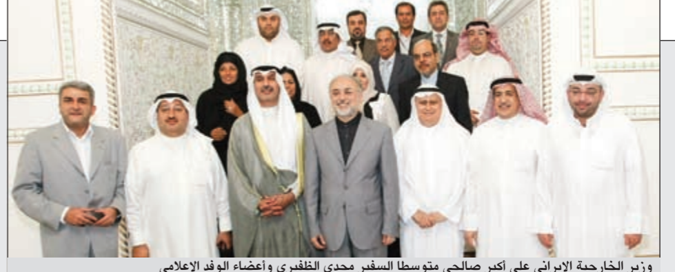
وزير الخارجية الإيراني علي أكبر صالحى متوسلا السفير مجدى الظفيري وأعضاء الوفد الإعلامي وزير الخارجية الإيرانية علي أكبر صالحى متوسلا السفير مجدى الظفيري وأعضاء الوفد الإعلامي

وزير الخارجية الإيرانية علي أكبر صالحى متوسلا السفير مجدى الظفيري وأعضاء الوفد الإعلامي حريصون على أمن واستقرار المنطقة