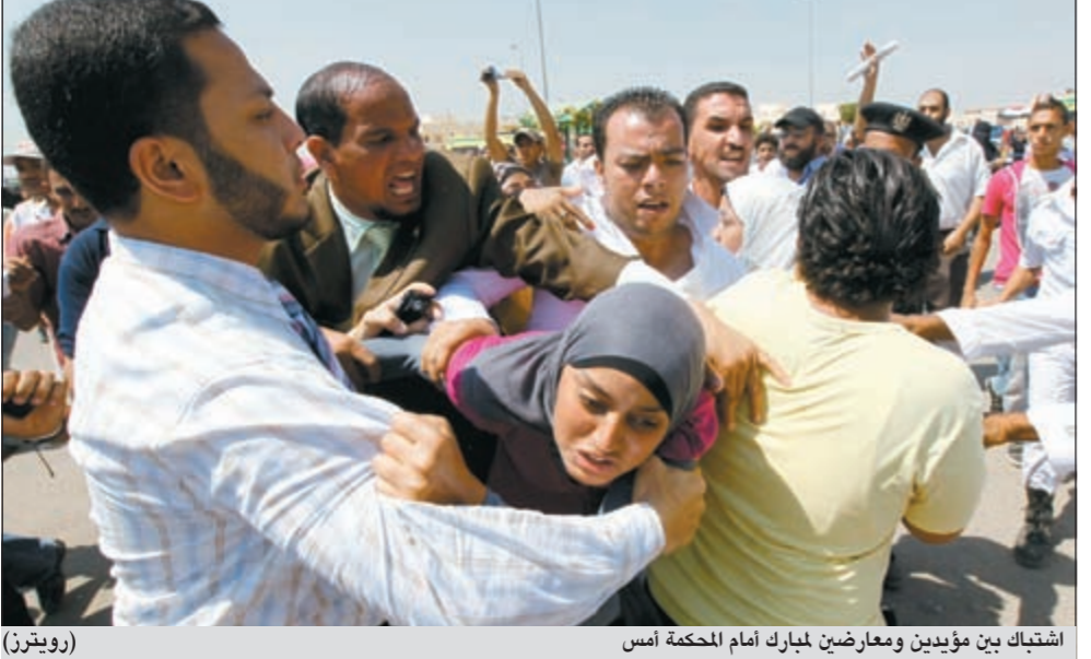
اشتباك بين مؤيدي ومعارضين لمبارك أمام المحكمة أمس

عواصم- وكالات: طلبت سورية من الأمين العام لجامعة الدول العربية نبيل العربي تاجيل زيارته لدمشق التي كان من المقرر أن تتم أمس «الأسباب موضوعية أبلغ بها». ولم تفصح وكالة الأنباء السورية التي أوردت النبا عن هذه الأسباب، مشيرة إلى أنه سوف يتم تحديد موعد لاحق للزيارة، إلا أن نائب الأمين العام لجامعة الدول العربية أحمد بن حلي أكد أمس أن «العربي سيزور سورية بعد غد السبت»، مشيرا في حديث للصحافيين إلى أنه «جرى اتصال هاتفي بين العربي ووزير خارجية سورية وليد المعلم، وقرر خلاله أن تتم الزيارة بعد غد». ميدانيا، ما زالت الحملة العسكرية السورية مستمرة حتى اللحظة في معظم المدن السورية، حيث أفاد ناشطون حقوقيون عن مقتل 17 شخصا على الأقل في أوسع حملة أمنية تشهدها حمص منذ انطلاق الاحتجاجات. وفي الوقت نفسه فشلت موسكو وباريس في تقريب المواقف حيال الملف السوري، ودعا وزير الخارجية الفرنسي آلان جوبيه موسكو إلى تأييد عقوبات دولية ضد دمشق، فيما اعتبر نظيره الروسي سيرغي لافروف أن المعارضة السورية «اختارت المواجهة» مع النظام، ودعاها مجددا إلى الجلوس لطاولة الحوار. • التفاصيل ص 31