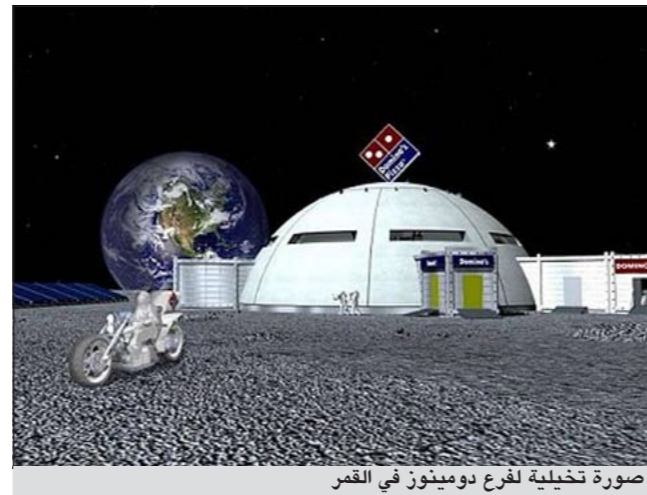
صورة تخيلية لفرع دومينو في القمر

عندما زودت بغطائها طاقم رواد فضاء يدورون حول الأرض داخل «المحطة الفضائية الدولية». غير أن «دومينو بيتزا» ردت عليها في العام الماضي بسلسلة مناسبات نظمتها بمناسبة الذكرى السنوية الـ 25 لدخولها السوق اليابانية. وفي ديسمبر، دفعت «دومينو بيتزا» مبلغ 2,5 مليون ين (أكثر من 26 ألف دولار أميركي) لشخص لقاء ساعة عمل في تسليم فطائر البيتزا للزبائن.