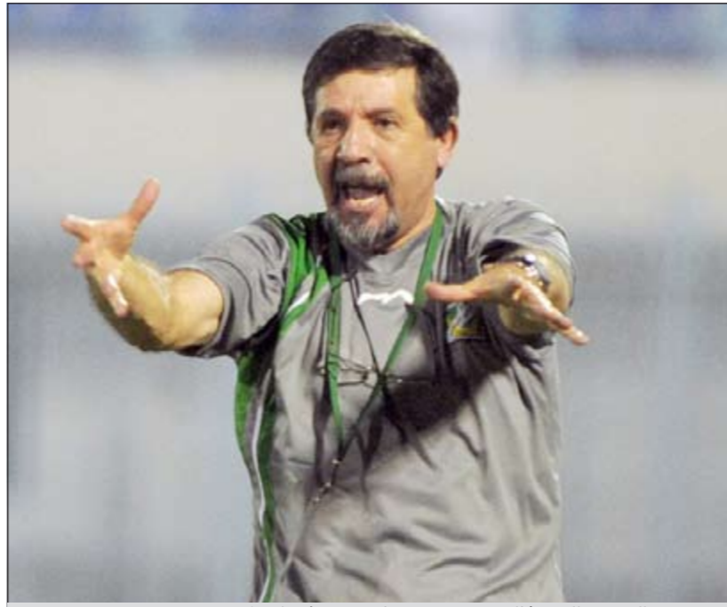
مدرب العربي البرتغالي جوزيه روماو يصرخ على لاعبيه

وشدد روماو على ان الشباب ليس عقدة للفريق الاخضر، وقال: لا تعني خسائرتنا المتكررة مؤخرا من الخصم انه اصبح عقدة ولكن لكل مباراة ظروفها ونحن لم نضع الفوز في الحسبان لحظة الدخول الى المباراة على الرغم من اهمية ذلك، لكن اولوياتنا في هذه المرحلة هي اعداد فريقنا بالشكل الامثل من خلال هذه البطولة وفسق البرنامج المعد للفريق، لذلك فالنتيجة في الوقت الحالي لا تعيننا.