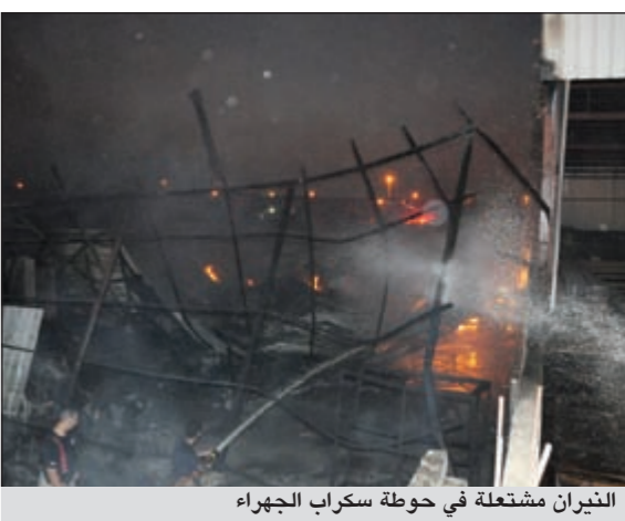
النيران مشتعلة في حوطة سكراب الجهراء

سيطرت فرق الإطفاء على حريق اندلع في قسيمة صناعية بمنطقة سكراب الجهراء بعدما التهمت النيران قسمين من الأقسام الـ 3 للقسيمة التي تبلغ مساحتها 1050 متراً مربعاً، وحالت جهود الإطفاء دون وصول النيران للقسم الثالث الذي تبلغ مساحته 400 متر، والمخازن الصناعية المجاورة، والمخصص لأعمال ميكانيكية بعدما كانت النيران قد انتشرت في قسم معمل الفيبرغلاس والذي تبلغ مساحته 250 متراً مربعاً والقسم الثاني الذي تتم فيه أعمال الحدادة والبالغة مساحته 400 متر مربع.