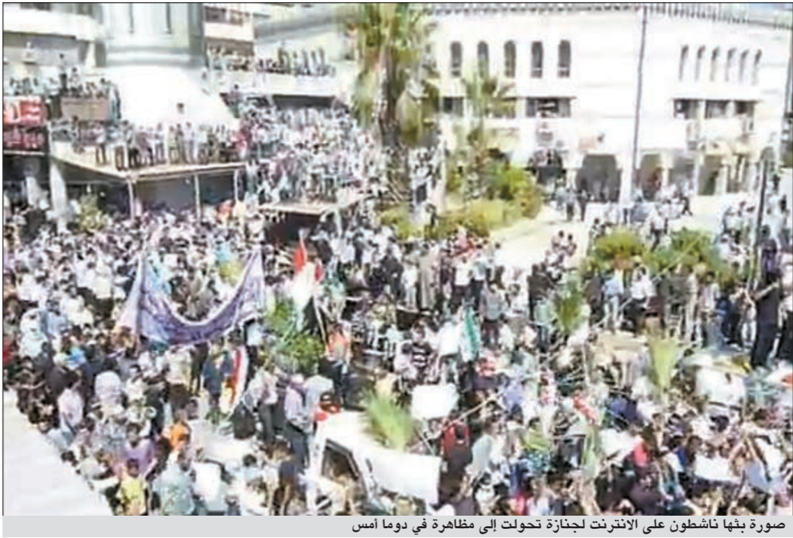
صورة بنها ناشطون على الإنترنت لجنازة تحولت إلى مظاهرة في دوما أس

وأوضح المصدر أن الزيارة تأتي تلبية لدعوة رسمية من مارغولوف، ولفت إلى أنه بالإضافة إلى المباحثات مع مارغولوف سيعقد لقاءات مع برلمانيين ومسؤولين روس.