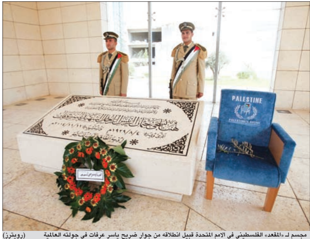
مجسم لـ «المقعد» الفلسطيني في الامم المتحدة قبيل انطلاقه من جوار ضريح ياسر عرفات في جولته العالمية

عواصم - وكالات: افاد ناشطون حقوقيون بأن 9 أشخاص قتلوا في سورية أمس بينهم 7 في حمص وريفها خلال عمليات أمنية فيما اقتحمت قوات من الجيش والأمن مدينة حماة واطلقت النيران بكثافة من الأسلحة الثقيلة. بينما قال آخرون أن الحماسي العام لحماة عن عدنان بكور الذي أعلن انشقاقه عن النظام قبل أيام قد وصل إلى قبرص.