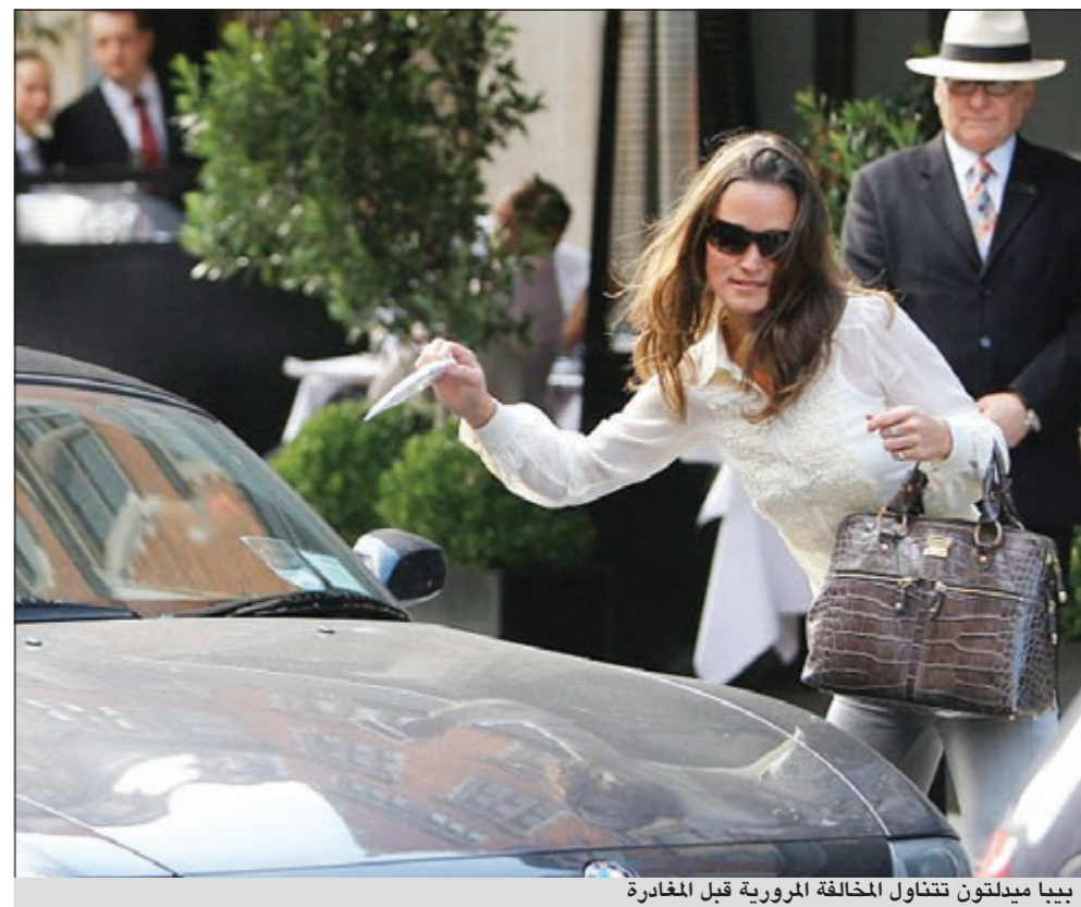
بيبا ميدلتون تتناول المخالفة المرورية قبل المغادرة