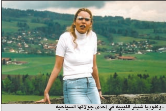
..وكلوديا شيفر الليبية في إحدى جولاتها السياحية