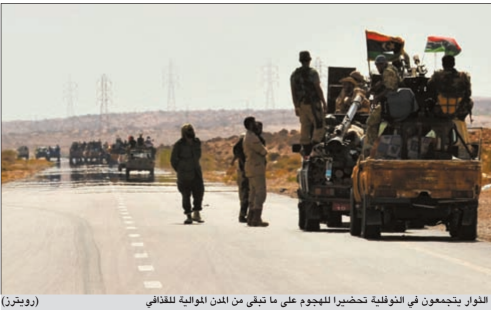
الثوار يتجمعون في النوفلية تحضيرا للهجوم على ما تبقى من المدن الموالية للقذافي (رويترز)

عواصم - وكالات: صرح المتحدث باسم المجلس الوطني الانتقالي في لندن أمس بأنه يتعين ان يمثل معمر القذافي امام المحكمة في ليبيا عن الجرائم التي وقعت في ظل حكمه، بغض النظر عن الاتهامات الموجهة من جانب المحكمة الجنائية الدولية ضد. وكانت المحكمة الدولية التي تتخذ من لاهاي مقرا لها قد أصدرت مذكرة توقيف بحق القذافي بتهمة ارتكاب جرائم ضد الإنسانية خلال الانتفاضة الليبية، فضلا عن مذكرتي توقيف آخرين بحق نجله سيف الإسلام ورئيس استخباراته عبدالله السنوسي. واعتبر جمعة القمطاي منسق المجلس الانتقالي في بريطانيا ان القذافي ينبغي ان يحاكم في ليبيا.