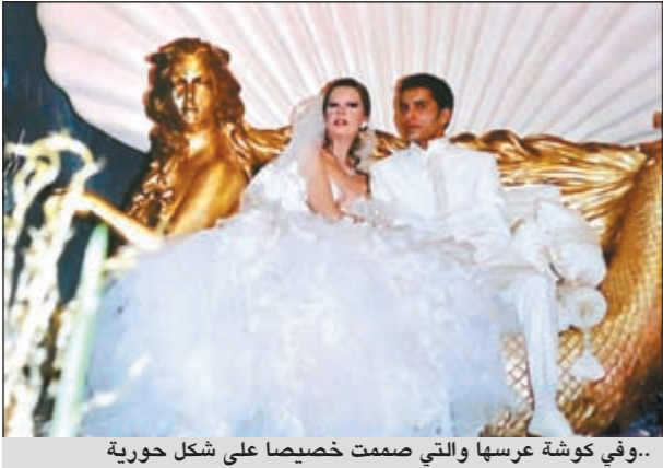
..وفي كوشة عرسها والتي صممت خصيصا على شكل حورية