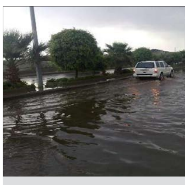
آثار السيول على شوارع جازان