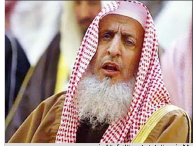
الشيخ عبدالعزيز بن عبدالله آل الشيخ

الرياض - وكالات: انتقد مفتي المملكة الشيخ عبدالعزيز بن عبدالله آل الشيخ المشككين في دخول شهر شوال، واعتبرهم من أهل الأهواء والفكر السيئ؛ واللسان البذيء. وبين آل الشيخ أن هناك من يريد أن يسلب العمل بسنة المصطفى ﷺ ويعتمد على آراء حسابات فلكية متناقضة