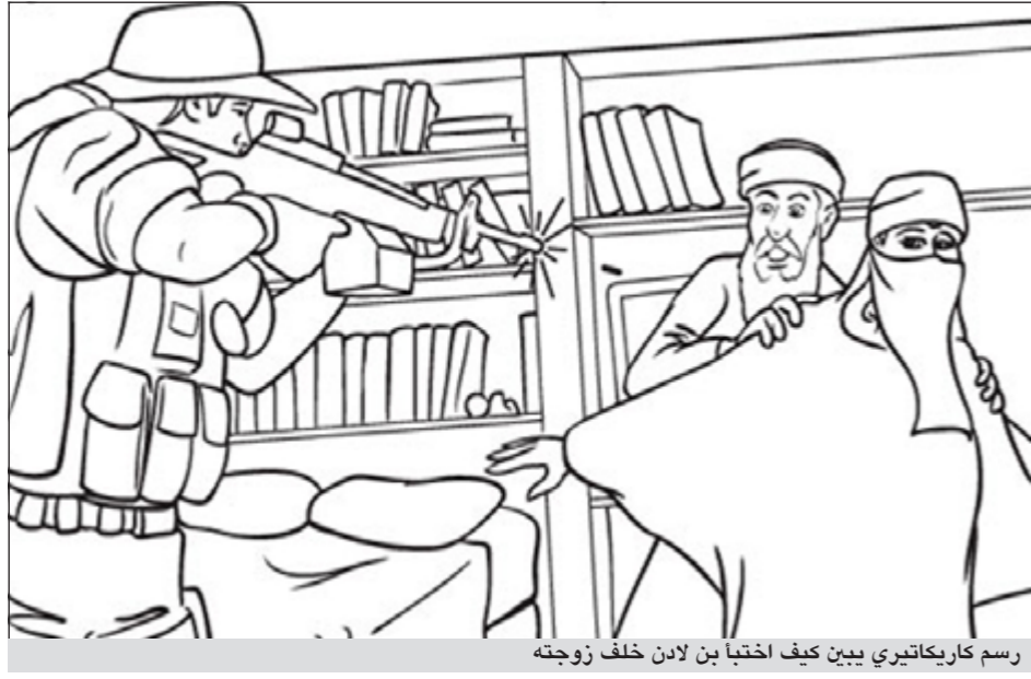
رسم كاريكاتيري يبين كيف اختبأ بن لادن خلف زوجته