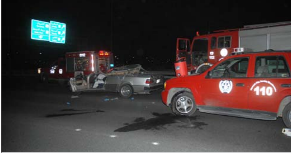
رأس الوالد المصري في المركبة الألمانية طارت بفعل قوة الاصطدام (سعود سالم)