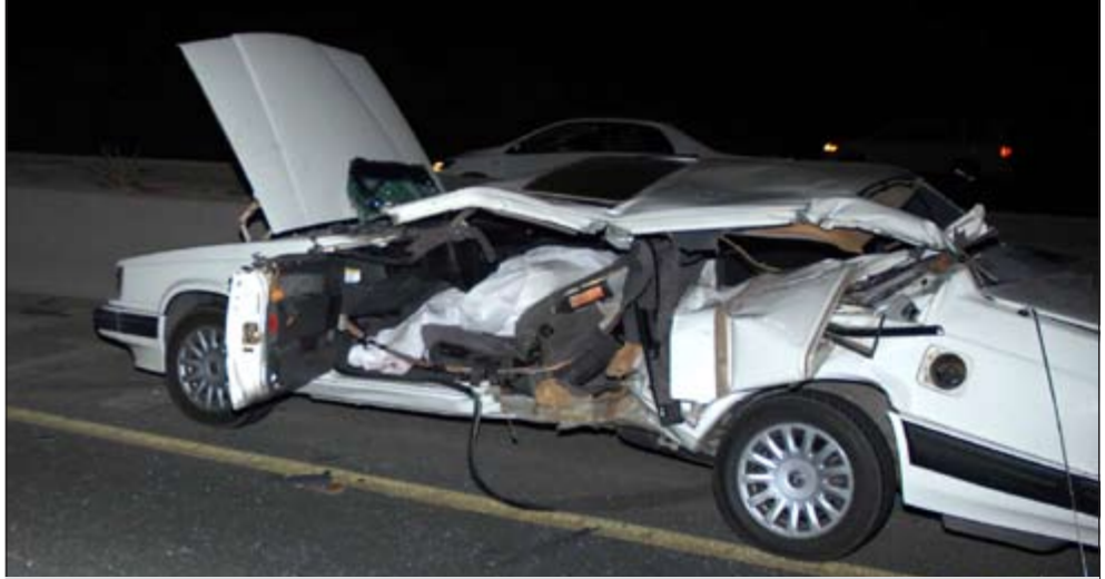
السيارة الأوروبية وقد تهمتش بالكامل جراء اصطدامها بالسطحة

قائد المركبة الأوروبية، وهو مواطن، تفادي الحادث ليتعرض لما تعرض له الوافد المصري، حيث كتبت النجاة لقائد دراجة نارية بعد ان سقط من دراجته اثناء توقفه قبل الاصطدام بالمركبة الثالثة.