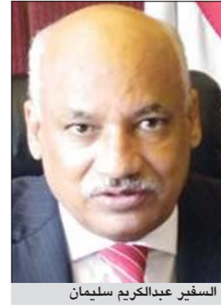
السفير عبدالكريم سليمان

مبنى جديد للسفارة يليق بمكانة ودور مصر بدأنا في وضع الماكينات الخاصة به