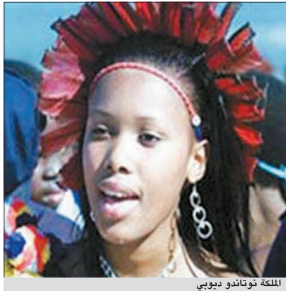
الملكة نوتاندو ديويي

شكت ملكة سوازيلاند الثانية عشرة لإحدى صحف جنوب أفريقيا من أن زوجها الملك يحتفظ بها سجنية إلى الأبد في قصرها الخاص، بعدما أطاق حراسها النقباب عن علاقة غير شرعية أقامتها مع وزير العدل في البلاد.