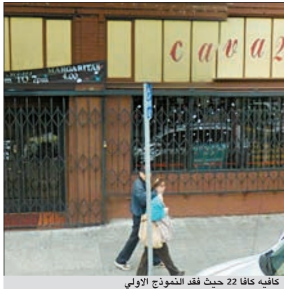
كافية كافا 22 حيث فقد النموذج الاولي

سان فرانسيسكو - د.ب.أ: هل سمعتم عن نموذج آي فون الذي كانت «آبل» شديدة التكتيم والحرص بشأنه إلى أن فقد في إحدى الحانات؟ إذا كنتم ممن يتتبعون آخر أخبار التكنولوجيا، فمن المحتمل أن تتذكروا تلك الحادثة التي أدت إلى فتح تحقيق شرطي مكثف العام الماضي عندما فقد مهندس يعمل لدى عملاق صناعة التكنولوجيا الأمريكية «آبل» النسخة التجريبية للجبل الرابع من هاتف «آي فون» الذي في إحدى الحانات المحلية، حسنا، تلك الكارثة حدثت مجددا، حسب تقرير لشبكة «سي نت» الإخبارية التي قالت إن أحد موظفي «آبل» أخذ نسخة الخاصة من نموذج «آي فون 5» لحانة «كافا 22» في ضاحية ميشن في سان فرانسيسكو، وترك النموذج هناك بعد احتساء الكثير من التيكلا. وذكر التقرير أن «آبل» اب لغت الشرطة أن جهازا «لا تقدر قيمته بثمن» قد ضاع، وأنهم تمكنوا من تتبع أثره وصولا إلى منزل في سان فرانسيسكو لكن عملية البحث باءت بالفشل. وأضاف التقرير أن الهاتف قد يكون عرض للبيع عبر مواقع الإنترنت مقابل 200 دولار لا أكثر.