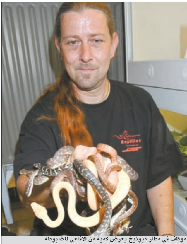
موظف في مطار ميونيخ يعرض كمية من الافاعي المضبوطة

مسنند للقدمين ويبدو أن صدمة سببت فيها حفرة بحجم ملعب لكرة مضرب. وشرح ستيف سكوابرز المسؤول الرئيسي عن «أوبورتونيتي» في مؤتمر صحافي أن هذه الصخرة المسماة «تيسدايل-2» تبدو «مختلفة عن بقية الصخور المكتشفة على المريخ». وأضاف أن «تركيبتها شبيهة بتركية بعض الصخور البركانية لكنها تحتوي على كمية أكبر من الزنك والبروم (...) وبالتالي نحن واتقن من أن الوصول إلى قوهة انديفر هو فرصة ثانية لاوبورتونيتي»