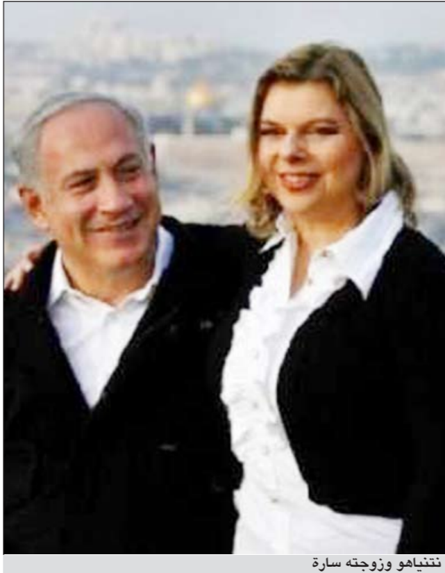
نتنياهو وزوجته سارة

ويطول الخميس تدخل المدعي العام الاسرائيلي وقال انه يتعين على عائلة رئيس الوزراء تعيين متحدث خاص للتعامل مع الأمر وهو ما حدث، وكان أول ما أعلن عنه المتحدث الجديد هو طرد الخادمة.