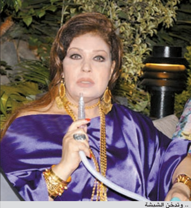
... وتدخن الشيشة