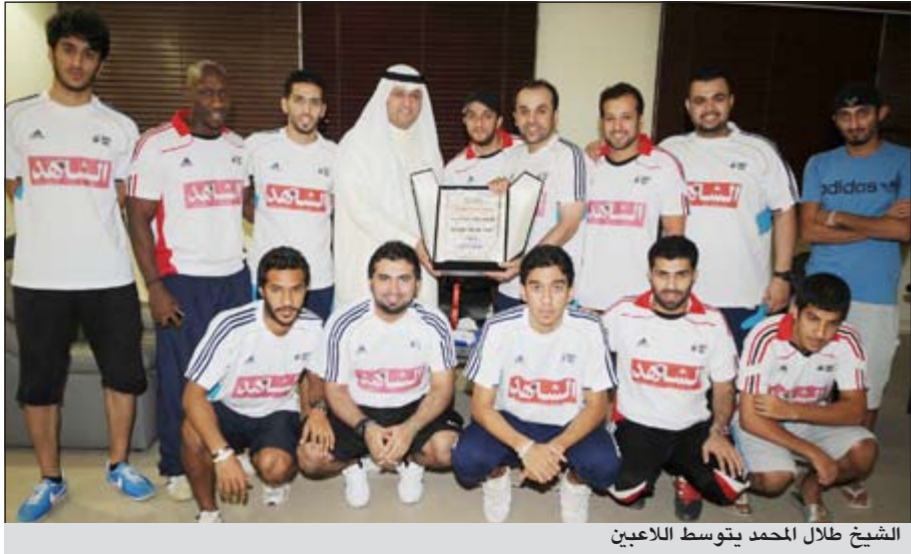
الشيخ طلال المحمد يتوسط اللاعبين

منتخب الصالات للمشاركة في التصفيات الآسيوية التي ستعقد في الكويت في ديسمبر المقبل. وأثنى الحمد على جهود مجلس اتحاد كرة القدم بقيادة الشيخ طلال الفهد لإنشاء لعبة كرة الصالات وزيادة شعبيتها على المستوى، مشيداً أيضاً بالدور الكبير الذي تقوم به لجنة الصالات والشواطئ، وهو ما انعكس على المسابقات المحلية التي ظهرت بشكل رائع في الموسم الماضي.