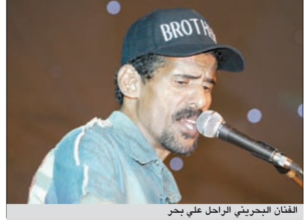
الفنان البحريني الراحل علي بحر

رحيله على تلحين أغنية «تكبر صاحبني» من كلمات الشيخ دعيج الخليفة، وبالفعل لحنها ووضع صوته عليها، ولكن القدر لم يمهل فقررت ان اضمها للألبوم واسجل صوتي بعده. وأردف: الألبوم سيكون بروح فيصل الخرجي الشبانية وضممت له ايضا دويتو «فصا عيني» مع الفنانة المصرية سماح وأغاني أخرى