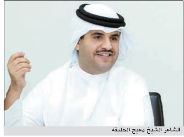
الشاعر الشيخ دعيج الخليفة