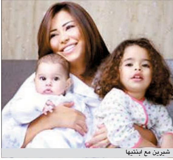
شيرين مع ابنتيها

تحدثت الفنانة شيرين عبد الوهاب عن ذكريات طفولتها خلال أيام العيد، مؤكدة أن العيد كان يعني الفرحه والبهجة والملابس الجديدة بالنسبة إليها. وقالت خلال سهره «سوبر ستار» مع المذيعه سالي شاهين التي عرضت على قناة «الحياة»، إن العيد ينقسم بين العمل والزيارات العائلية لوالدتها وحماتها. وعن ذكرياتها مع كعك العيد، أجابت أنها كانت تساعد والدتها خلال طفولتها في إعداده. وهو الأمر الذي تحاول أن تغرسه في ابنتيها وخصوصا الكبرى مريم التي تساعدنا في صنعها. وعما إذا كانت تشتري ملابس العيد لطفليتها، أوضحت أنها تشتري لمريم وهنا ملابس طوال العام من الخارج، مضيفة أنها لا تفضل الخروج معها في أيام العيد، إذ تخشى عليها من الزحمة والتفاف الجمهور حولها.