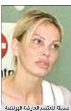
صديقة المعتصم المعارضة البولندية