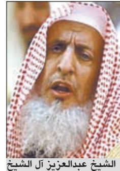
الشيخ عبدالعزيز آل الشيخ