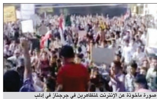
صورة مأخوذة عن الإنترنت للتظاهرين في جرجان في ألب

محافظة إدلب ودير الزور وريف دمشق وحمص، وأكد المرصد أن هذه المحافظات شهدت حملة اعتقالات بعد خروج عدة مظاهرات أمس الأول. في هذه الأثناء بث ناشطون على الإنترنت تسجيلاً أعلن المدعي العام في مدينة حماة عدنان بكور فيه استقالته من منصبه احتجاجاً على أعمال القمع، لكن وكالة الأنباء السورية الرسمية (سانا) نقلت عن محافظ حماة أنس الناعم قوله إن «المحامي العام أجبر