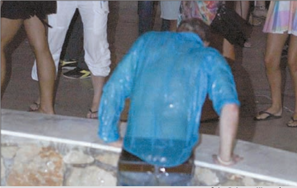
.. ويخرج مبتلا من حمام السباحة