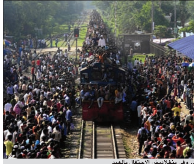
.. وفي بنغلاديش الاحتفال بالعيد

ما تسبب في حالة من الإحباط بين الضائمين في أكبر الدول الإسلامية سكاناً. ويحتفل الإندونيسيون -90٪ منهم مسلمون- بعيد الفطر بولائم وملايس جديدة لكنهم اضطروا إلى إعادة عكس العيد إلى الخزانات والانتظار ليوم آخر. وصام المسلمون في اندونيسيا الثلاثاء في حين فتحت المراكز التجارية أبوابها بعد أن كانت قررت الإغلاق. لكن أعضاء الطائفة المحمدية ثاني أكبر طائفة إسلامية في البلاد احتفلوا بالعيد أمس إذ اختلفت آراء الفلكيين في تحديد يوم العيد. أما في مصر وتونس فقد كان العيد عيدين عيد الثورة وعيد الفطر.