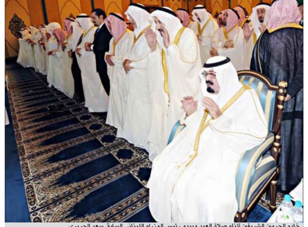
خادم الحرمين الشريفين أثناء صلاة العيد ويبدو رئيس الوزراء اللبناني السابق سعد الحريري

11 دولة عربية احتفلت بالعيد أمس وليبيا وعمان والأمم المتحدة تحتفل اليوم