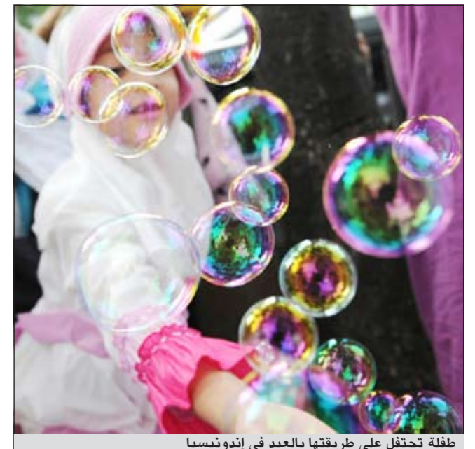
طفلة تحتفل على طريقها بالعيد في اندونيسيا

تمتع بـ 50% رصيد مجاني وعيد على كل الناس