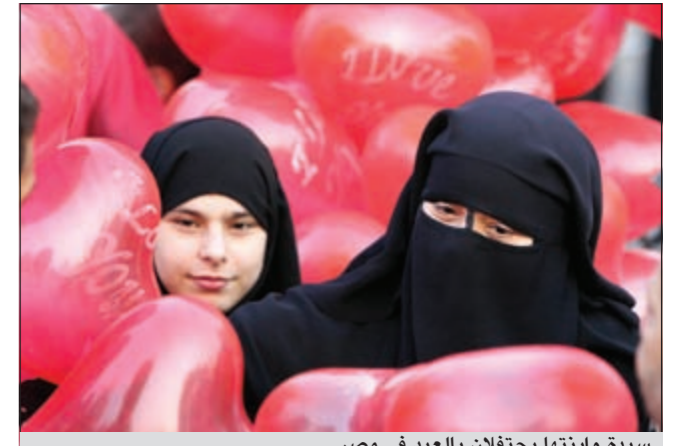
سيدة وابنتها يحتفلان بالعيد في مصر

مكة المكرمة - أ.ش.أ: أدى نحو مليونين من المسلمين صباح أمس صلاة عيد الفطر المبارك في الحرم المكي والنبوي الشريفين في أجواء آمنة مطمئنة مفعمة بالخشوع لله والخضوع له سبحانه وتعالى بعد أن انعم الله عليهم بصيام شهر رمضان المبارك وقيامه. وقد أدى خادم الحرمين الشريفين الملك عبدالله بن عبدالعزيز وكبار المسؤولين السعوديين صلاة عيد الفطر المبارك مع جموع المصلين بالمسجد الحرام.