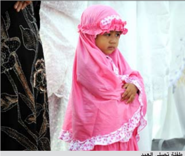
طفلة تصلي العيد