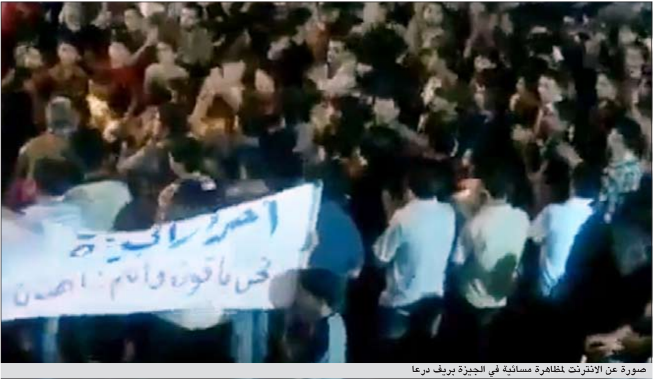
صورة عن الانترنت لمظاهرة مسائية في الجزيرة بريف درعا

بالإضافة الي داعل بريف درعا حيث اعتقلت الأجهزة الأمنية 6 أشخاص من عائلة واحدة». من جهة أخرى وللمرة الثالثة منذ اندلاع الاحتجاجات كانت مدينة الرستن التابعة لحمص وناقلات جند وسيارات عسكرية اقتحمت صباح أمس بلدة هيت التي تقع على بعد كيلومترين من الحدود مع شمال لبنان، وأضاف ان «اصوات إطلاق نار سمعت صباحا»، مشيرا إلى «سقوط خمسة جرحى». وأكد الناشط أنه «تم خلال العملية إحراق منازل لناشطين مطلوبين في هذه البلدة التي اعتقل فيها نحو 13 شخصا»، وذكر مدير المرصد ان «حملات اعتقالات ومداهمات واسعة جرت في قدسيا بريف دمشق