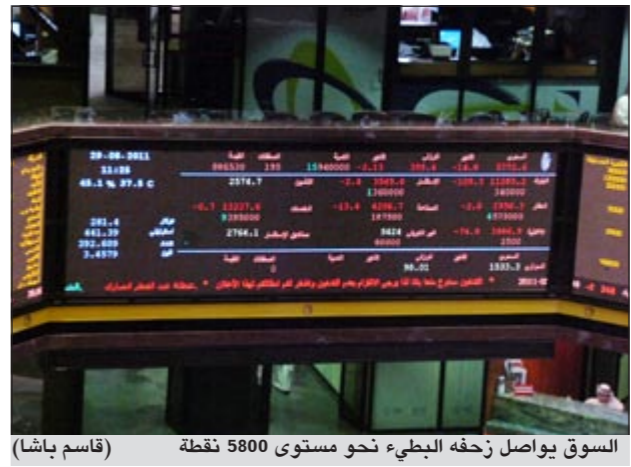
السوق يواصل زخفه البطني نحو مستوى 5800 نقطة (قاسم باشا)