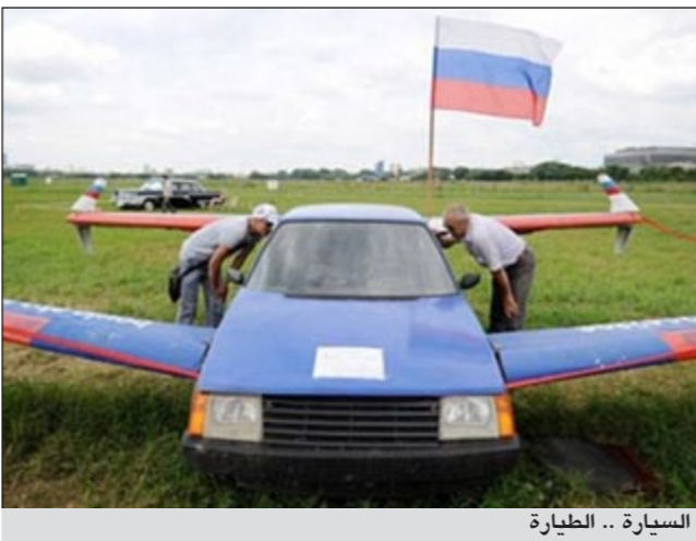
السيارة .. الطائرة

اسم اسم Bulgakov.V: تطير السيارة عندما تصل سرعتها لـ 100 كيلومتر في الساعة، وترتفع حتى ثلاثة أمتار فقط لمسافة لا تتجاوز الـ 200 متر، وهي وإن كانت مسافة صغيرة للغاية إلا انها مقنعة بالنسبة للتجربة الأولية، وقام بولجاكوف باستخدام نموذج بأربعة أجنحة لجعلها أكثر أمنا أثناء الطيران، وتستغرق السيارة نحو 20 ثانية للوصول لسرعة الطيران. على الرغم من ان بولجاكوف كان يهدف بالأساس لجعل سيارته الطائرة منتجاً تجارياً الا انه قرر بعد ذلك استخدامها في تدريب الطيارين الجدد على الاقلاع والهبوط.