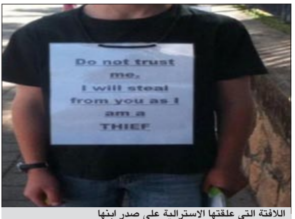
اللافتة التي علقتها الأسترالية على صدر ابنتها

سيدني - وكالات: أثارت أم أسترالية الكثير من الجدل بعدما عاقبت ابنتها، 10 سنوات، بطريقة «مهيبة»، بإجبارها على وضع لافتة على صدره، والوقوف في الشارع على الملأ، ليعلن أنه «لص».