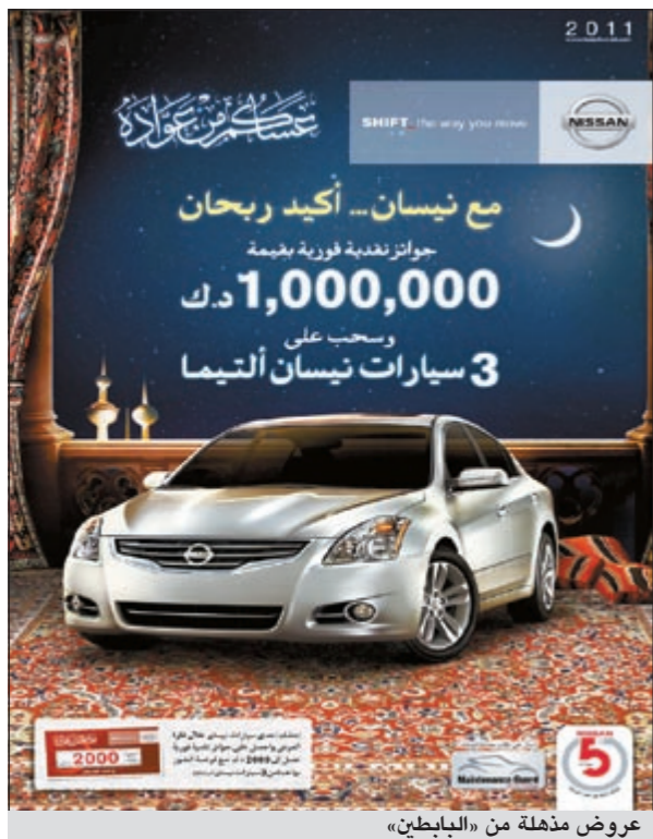
عروض مذهلة من «البابطين»

احتفالاً بحلول شهر رمضان الفضيل وضمن الإقبال المميز على سيارات نيسان، تستمر شركة عبدالمحسن عبدالعزيز البابطين الوكيل الحصري لسيارات نيسان بالكويت في تقديم عروض رمضان مدهلة تضمن لمن يشترى إحدى سيارات نيسان خلال الشهر الفضيل الحصول على قسائم «امسح واربح» بمبلغ نقدية تصل قيمتها إلى 2000 دينار، إلى جانب فرصة دخول السحب والفوز بواحدة من 3 سيارات انيما موديل 2011. الجديد بالذكر أن الجوائز النقدية المقدمة من شركة عبدالمحسن عبدالعزيز البابطين تصل قيمتها إلى 000,000.1 دينار، ومن خلال حرص الشركة على إرضاء عملائها قامت بتكريس جهودها لتقديم عروض مميزة ومفيدة للعملاء ولجميع من يرغب في اقتناء سيارة نيسان التي تتسم بالمتانة والرفاهية والاقتصاد، كونها سيارات تغطي جميع احتياجات السوق من سيارات للركاب وسيارات تجارية بأحجام مختلفة، ولذلك يمكن أن تتوجه إلى معارض نيسان في الري أو الأحدي لتستمتع بالأجواء الرمضانية المميزة وللتأكد من