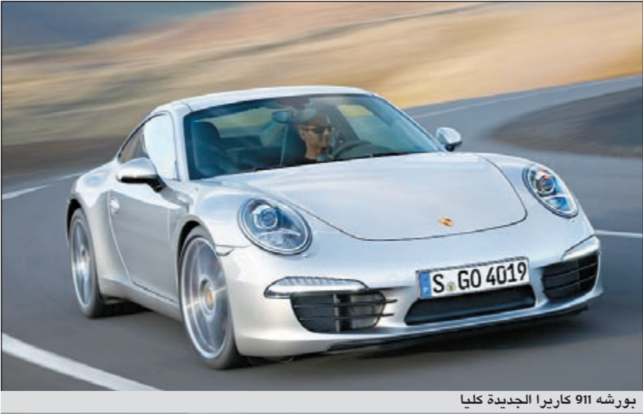
بورشه 911 كاريرا الجديدة كلياً

الأمينوم والفلواذ، يعود الفضل إليه في خفض وزن السيارة بمقدار كبير يبلغ 45 كلغ، بالتناغم مع تحقيق صلابة أكبر بكثير. ويفضل الخطوات العديدة المعتمدة لتعزيز دينامية السيارة الهوائية، ومن ضمنها استبدال عاكس الهواء الخلفي السابق بأخر أرفع قابل للامتداد بشكل متغير، جرى الحد من عوامل الرفع على جسم «911 كاريرا» الجديدة، مع المحافظة على معامل مقاومة هواء جيد. وبالانتقال إلى مقصورة الركاب، نجدها تتسجج مع التصميم الخارجي العصري بفضل تصميمها الجديد الذي استلهمته من طراز بورشه «كاريرا جي تي» GT Carrera الأسطوري، فالسائق بات مندمجاً بشكل أوفق بحجرة القيادة، بفضل اعتماد كونسول وسطي مرتفع في مقدمته واتخاذ مقبض علبة التروس وضعية مرتفعة قريبة من المقود، كما هو معاد في سيارات السباق، ومثلما هو الأمر في التصميم الخارجي، نجد عناصر بورشه الكلاسيكية في مقصورة الركاب أيضاً. وفي هذا السياق، اتخذ قفل الإشعال مكاناً له على يسار المقود، وتضمنت لوحة المؤشرات خمسة عدادات دائرية - تحتوي على شاشة متعددة الوظائف عالية الدقة - يتوسطها عداد دورات المحرك. وكما هو الأمر مع أجيال السيارة السابقة، تطل «911 كاريرا» و«911 كاريرا إس» الجديدتان لترسيما معايير رائدة في فئتهما ترفع سقف التحدي مجدداً في نطاق الأداء والفاعلية، فكلما نسختي السيارة تسجلان معدل استهلاك للوقود متديناً للغاية، يقل كثيراً عن حاجز 10 لترات/100 كلم.