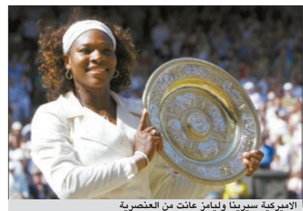
الأميركية سيرينا وليامز عانت من العنصرية

من جانب آخر، قال لاعب التنس الفرنسي ميشيل ليودرا انه لم يتوجه بكلام عنصري للحكم الدولي المغربي محمد الجناتي خلال لقاء جمعه باللاعب البلجيكي ستيف دارسيس في دوري رولان غاروس. وقال ليودرا في تصريحه: «أتذكر جيداً ما نطقتم به، فمحمد الجناتي صديقي، وقد تعودنا أن نمزح مع بعضنا خارج رقعة الملعب، وأن أقول له مثل هذا الكلام منذ أن لعبت في دوري الدار البيضاء».