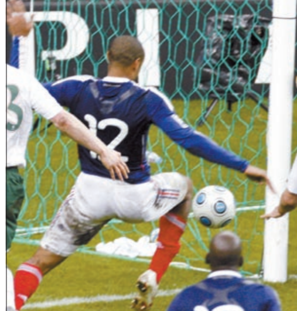
الفرنسي تيري هنري

المباراة، ليحتكم الفريقان إلى الأشواط الإضافية، التي استطاع فيها أصحاب الأرض تسجيل هدف غير شرعي أثار زوبعة من الاحتجاجات من دون جدوى، حيث حملت الدقيقة 103 لللغة التي جاء على إثرها الهدف بعد أن قام تيري هنري بتوقيف الكرة بيده في لحظة بدت واضحة جداً ومررها إلى زميله غالاس الذي سجل هدف التأهل، ورغم اعتراض الاتحاد الإيرلندي على الهدف ومطالبته بإعادة المباراة إلا أن الفيفا رفضت ذلك في الوقت الذي اعترف فيه هنري بأنه لمس الكرة بيده.