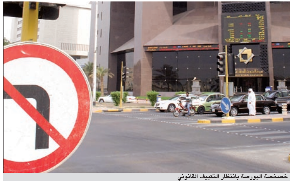
خصخصة البورصة بانتظار التكيف القانوني

إلى هيئة الأسواق وفق قانون 7 لسنة 2010. وعلى الجانب الآخر، قللت مصادر أخرى من تبني مقترح «الغرفة» والاحتكام لرأي إدارة