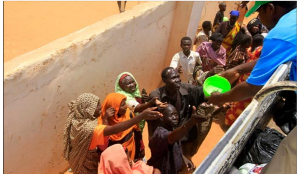
موظفون في شركة للمواد الغذائية يوزعون الهدايا في منطقة «أم درمان» في الخرطوم أمس

الوسطى وأوروبا الشرقية والشرق الأوسط. وقالت مصادر مطلعة إن مجموعة من ضباط شرطة جنوب السودان اعتدت على مدير حقوق الإنسان في بعثة الأمم المتحدة في البلاد الأسبوع الماضي. وأضافت أن مجموعة من 10 إلى 14 ضابط شرطة اعتدوا بالصفع والركل والضرب على مندوبيك سنوه - وهو من غرب أفريقيا - في فندق جنوب السودان في جوبا صباح السبت بعد أن رفض السماح لهم بفحص متعلقاته الشخصية.