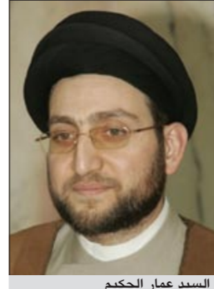
السيد عمار الحكيم