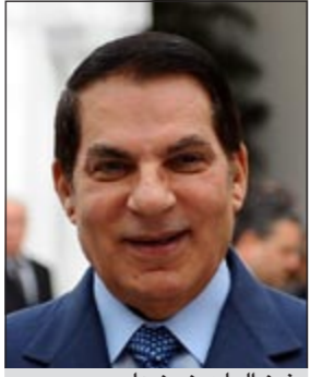
زين العابدين بن علي