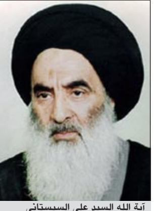
آية الله السيد علي السيستاني