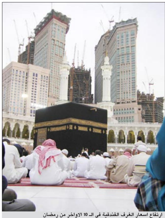
ارتفاع اسعار الغرف الفندقية في الـ 10 الاواخر من رمضان

ونقلت صحيفة «الرياض» السعودية عن مسؤول حجوزات في أحد الفنادق الكبرى بمكة المكرمة والمطلة على الحرم بصورة مبشرة أن نسبة الحجوزات وصلت إلى 100%، ووصل سعر الغرفة الواحدة للشهر الأواخر إلى حوالي 40 ألف ريال (4 آلاف باليوم)، موضحا أن نسبة كبيرة