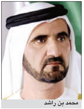
محمد بن راشد

وأضاف المخيزيم في تصريح لـ «الأنباء» أن زيادة الإقبال على العقار الاستثماري نتج عنه انخفاض العائد مقابل القيمة إلى نسب السوقي 8% أو 7%، لافتاً إلى أن التوصل الكويتي لا يستوعب إنشاء المزيد من العمارات الاستثمارية الجديدة، مطالبا الجهات المعنية بضرورة إعداد دراسات وفتح قنوات استثمارية تحضن هذه السيولة المالية الجمعة لتخفيف حدة الضغط أو