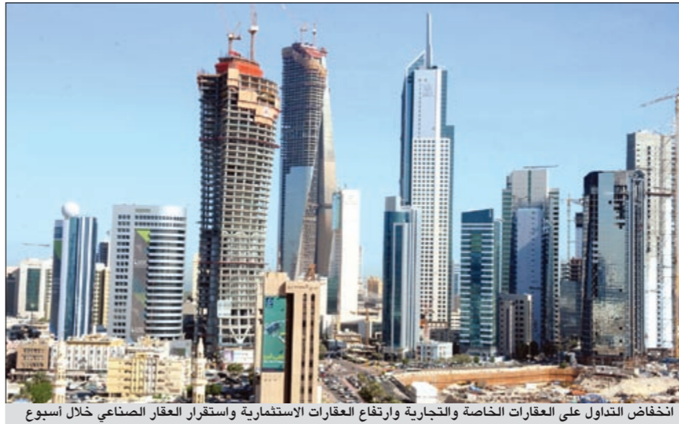
انخفاض التداول على العقارات الخاصة والتجارية وارتفاع العقارات الاستثمارية واستقرار العقار الصناعي خلال أسبوع