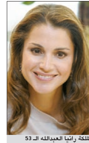
الملكة رانيا العبدالله الـ 53