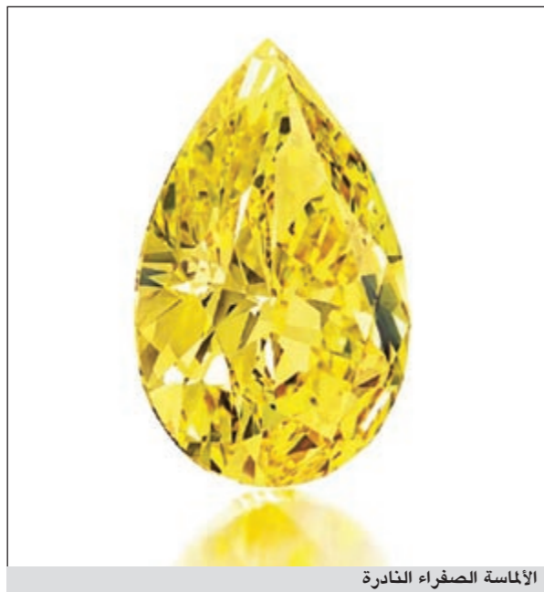
الألماسة الصفراء النادرة

ويكتسب الألماس الاصفر لونه من النتروجين الذي يأخذ محل ذرات الكربون في تركيبه الألماس، وكلما امتص الألماس النتروجين زاد اصفرار لونه. وستكون الألماسة الصفراء هي الابرز ضمن مجموعة تطرحها كريستيز في مزاد