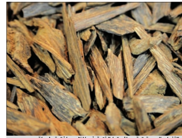
الأنواع الجيدة تبقى رائحتها الذكية في الملابس لفترة طويلة