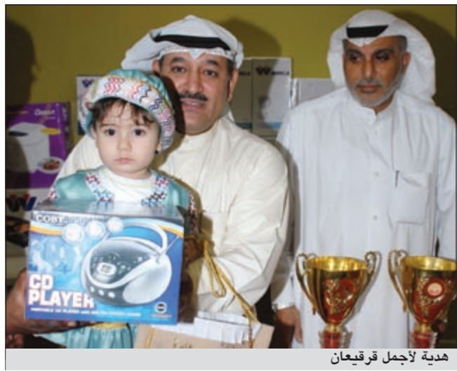
هدية لأجل قرقيعان