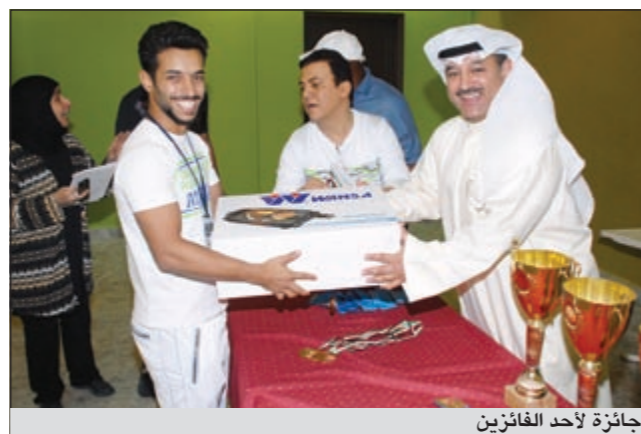
جائزة لأحد الفائزين