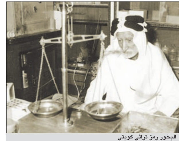
البخور رمز تراثي كويتي