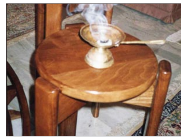
معرفة البخور الجيد تحتاج إلى الخبرة والممارسة

وتتكون فقاعات من الدهن عند احتراقه وهو غير مؤذ للعيون وتتميز عروق الدهن بلونها البني أو الأسود الغامق فضلا عن ثقل وزنه نسبيا كما يكون طعم العود المغشوش عند تذوقه مرا بينما الأصلي يمكن مضغه في الفم. وأشار الى ان بعض الباعة يقومون بعملية حشو للبخور بالبرصاص أو الشمع أو «البوتكس» من خلال عمل ثقب لزيادة وزنه ثم اغلاقه واعادة صبغه لاعطائه اللون الداكن. وقال ان دهن العود خلاصة زيوت خشب العود المصاب بعد احراقه وتقطيره ولمعرفة الأصلي توضع كسرة صغيرة منه داخل كوب ماء فإن طفا على السطح دل على جودته، والتجربة نفسها بوضع نقطة من دهن العود في كأس من الماء فإن ترسبت الى قاع الكأس واختلطت بالماء يكون النوع اصليا اما ان بقيت على سطح الماء مثل بقعة الزيت فإنه يكون مغشوشا. ورأى انه من الأفضل شراء البخور من المحال المختصة لبيع البخور وليس من الباعة الجائلين، مضافا ان الكمبودي من أفضل أنواع دهن العود وفي المقدمة منه «الملكي المعيا» يليه «السوري» ثم تباعا أرقام «1 و 2 و 3».