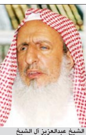
الشيخ عبدالعزيز آل الشيخ

وأضاف قائلاً: ينبغي لجميع المطلوبين أمينا أن يعودوا إلى رشدكم، وأن يحموا الله على أن هيأت لهم الدولة مثل هذه الفرص بالعودة إلى طريق الحق والرشاد، لكي يتداركوا أخطأهم ويصححوا أوضاعهم ويعودوا إلى رشدكم والصواب، واغتنام ما تبقى من الشهر الكريم المبارك ليكُونوا بين أهلهم وذويهم. وعلى صعيد العائدين من باكستان، أفادت المصادر بأنهما خضعوا لتحقيق أولي حول ظروف وكيفية مغادرتهما المملكة وتوجههما لمناطق صراع وشهدت وتشهد أعمالاً قتالية والتي يرجح أن تكون أقيمت في أفغانستان، في الوقت الذي مكنت وزارة الداخلية العائدين من الاتصال بذويهما الذين سبق