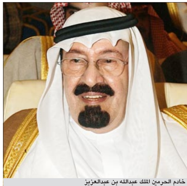
خادم الحرمين الملك عبدالله بن عبدالعزيز

واس: أكد خادم الحرمين الشريفين، الملك عبدالله بن عبدالعزيز آل سعود، أن ما يقدم في خدمة العقيدة الإسلامية في كلمة أمام لجنة الدعوة في أفريقيا ومعهم الدعاة المشاركون في الملتقى العشرين للجنة الدعوة في أفريقيا: «أشكركم وأتمنى لكم التوفيق، ونحن إن شاء الله معكم دائماً وهدياً في أي لحظة مستعدون لكل ما يطلب منا نحو عقيدتنا الإسلامية، وهذه ما لنا فيها لا عز ولا فخر، بل هذا واجب على كل مسلم، وشكراً لكم، والله أكبر».