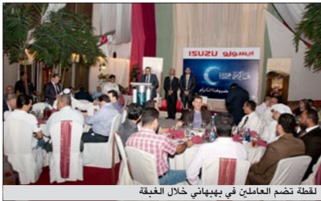
لقطة تضم العاملين في بيهباني خلال الغبقة

تنظمت شركة محمد صالح ورضا يوسف بيهباني - وكلاء ايسوزو في الكويت - للسنة الثالثة على التوالي غبقة رمضان لعملاء ايسوزو في فندق المارينا في السالمية. وقد لبي العملاء الدعوة وكان الحضور قوياً من اصحاب الشركات الكبرى وكبار المديرين التنفيذيين. وقد استمتع المدعوون بهذه الامسية المميزة في اجواء ساحرة وعلى انغام العود وأعرب الجميع عن سعادته بهذه الدعوة وتم توزيع عدد من الجوائز القيمة على الحضور.