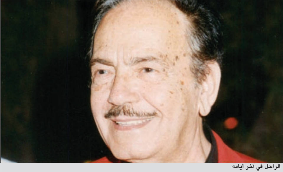
الراحل في آخر أيامه