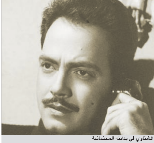
الشناوي في بدايته السينمائية