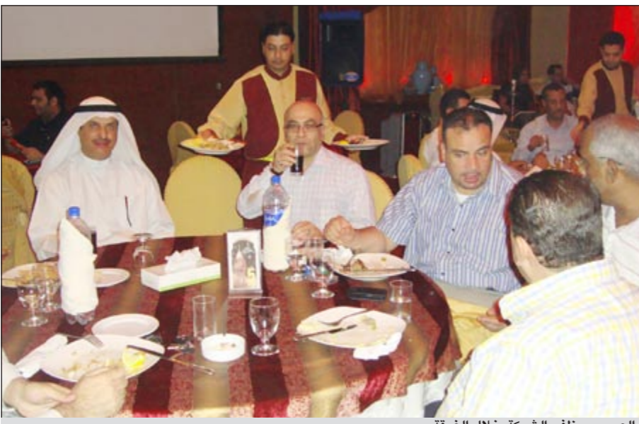
العمر وموظفو الشركة خلال الغبقة

روح الدفء في العلاقات بين موظفي الشركة وتنتشر روح الإخاء والتعاون مما يتعكس إيجاباً على أداء الجميع، كما أنها أصبحت من النواحي الاجتماعية التي تحرص الشركة على إقامتها خلال الشهر الفضيل من كل عام. وأشار العمر في تصريح صحفي إلى أن مثل هذه النشاطات تقوم بجمع موظفي الشركة مع قيادتهم بعيداً عن روتين العمل كما أنها تعزز من الترابط بين موظفي الشركة وتضفي جواً مميزاً من البهجة والمرح.