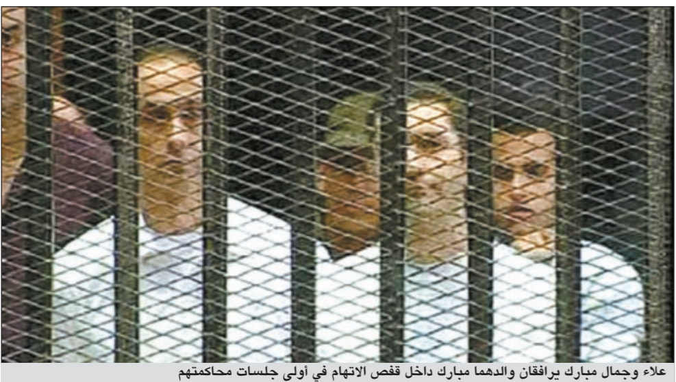
علاء وجمال مبارك يراققان والدهما مبارك داخل قفص الاتهام في أولى جلسات محاكمتهم

وفي 3 أغسطس 2011 وعلى مرأى من العالم اجمع بدأت المحاكمة العلنية للرئيس مبارك وابنيه علاء وجمال في نقطة حققت ما اعتبره كثيرون المؤشر الأهم على نجاح الثورة.