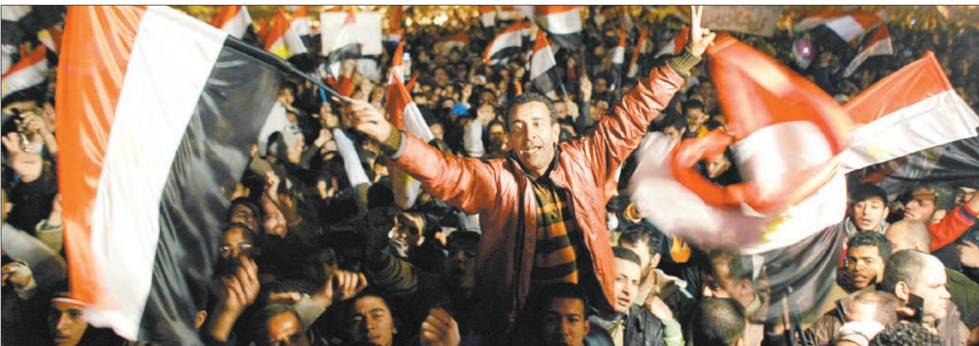
احتفالات المتظاهرين في ميدان التحرير بعد إعلان الرئيس مبارك التنحي عن الحكم